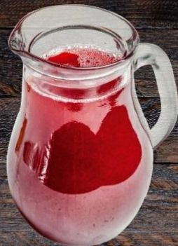
Морс яблочный, вишневый, клубничный

ванильный, клубничный, шоколадный, Чизкейк, Банан, Фрукты, Грейпфрут, соевый, апельсиновый