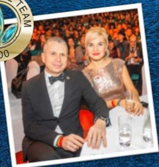
Millionaire Team 7500