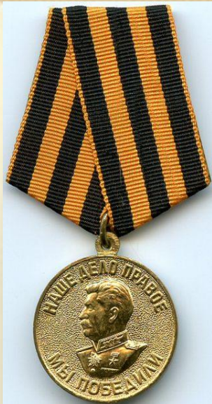
Медаль «За победу над Германией»