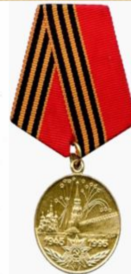
Юбилейная медаль «50 лет Победы в Великой Отечественн ой войне»