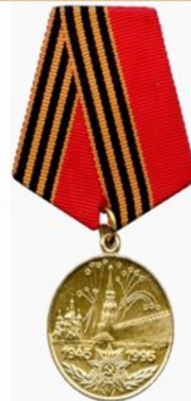
Юбилейная медаль «50 лет Победы в Великой Отечественн ой войне»