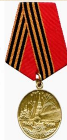
Юбилейная медаль «50 лет Победы в Великой Отечественн ой войне»