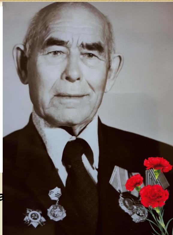
Орден отечественной войны 1 степени