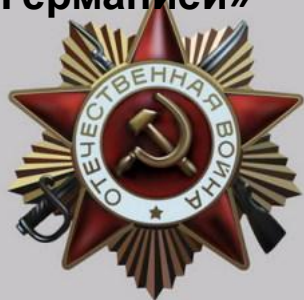
Орден отечественной войны 1 степени