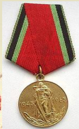
Юбилейная медаль «20 лет Победы в Великой Отечественн ой войне»