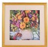
Товары для дома