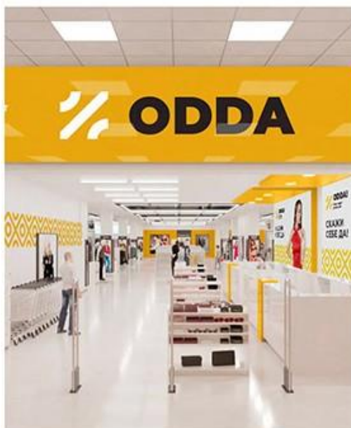
ДИЗАЙН ВХОДНОЙ ГРУППЫ