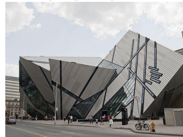
Королевский музей провинции Онтарио в Торонто, Канада, арх. Даниэлем Либескиндом