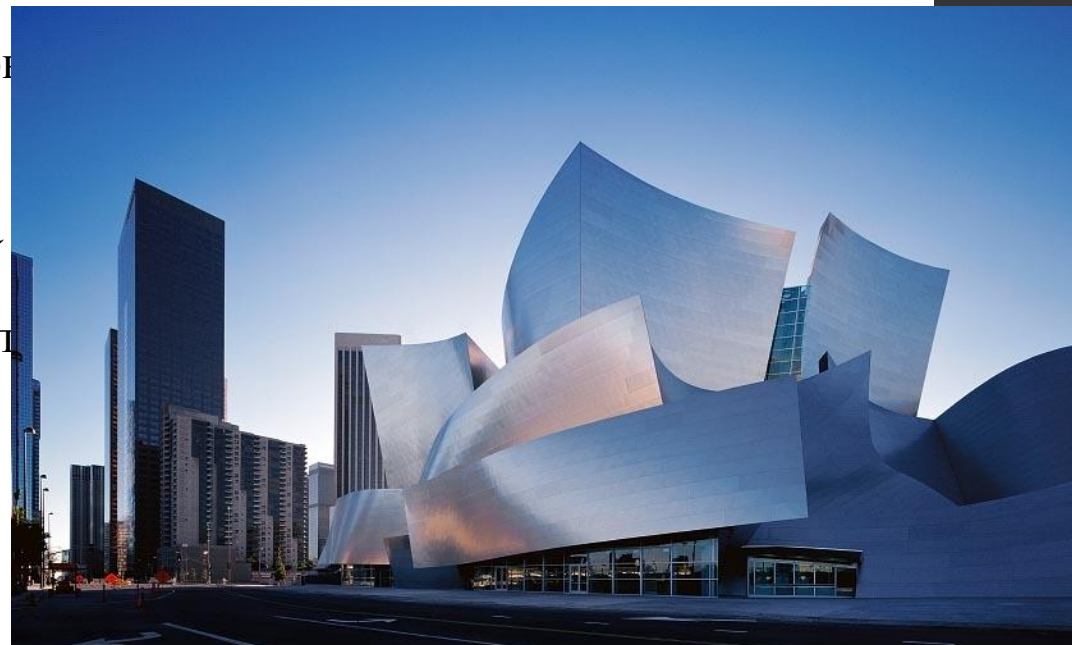
Концертный зал Уолта Диснея, Лос-Анджелес, арх. Фрэнк Оуэн Гери

Деконструктивизм — странный, но очень креативный стиль архитектуры XX века. Впервые появился в конце 1980-х годов главным образом в Лос-Анджелесе (штат Калифорния), а также в Европе. Деконструкция поощряет радикальную свободу формы и открытое проявление сложности в здании, а не строгое внимание к функциональным проблемам и элементам традиционного дизайна (таким как прямые углы или сетки).