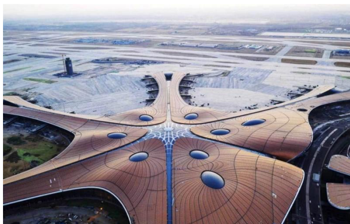
Аэропорт Пекин Дасин, арх. Заха Хадид