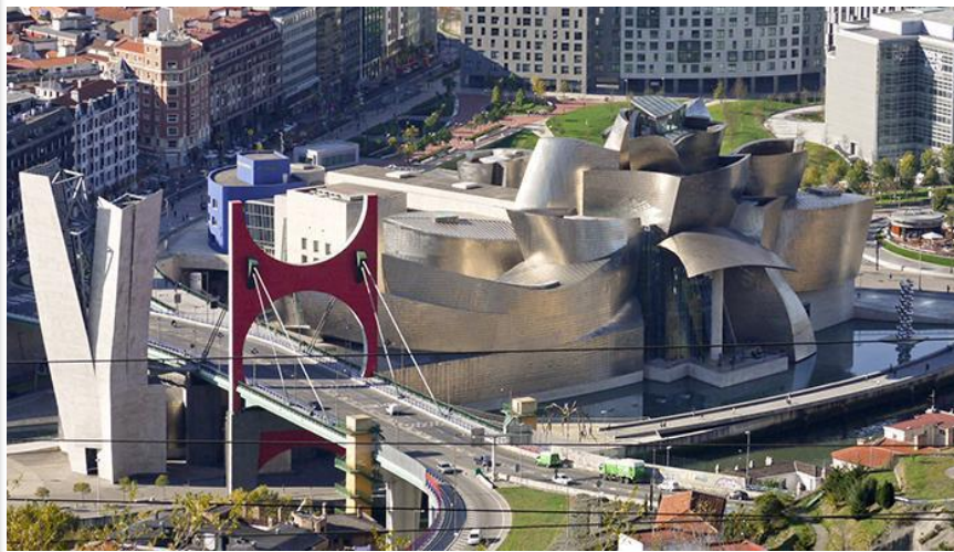
Музей Гугенхайма в Бильбао, Испания, арх. Фрэнк Гери