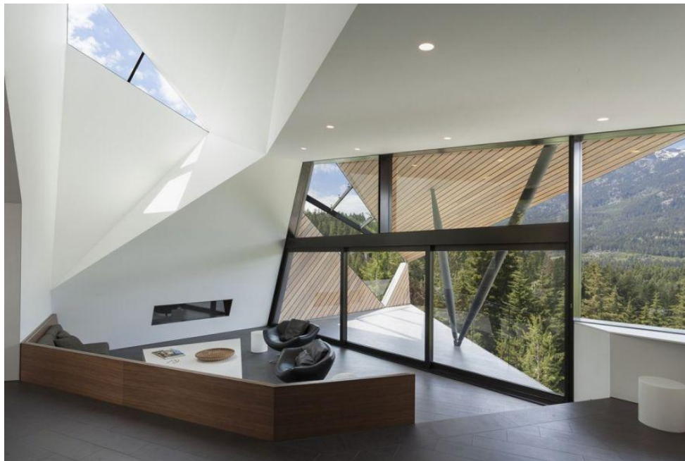
Архитекторы компании Patkau Architects