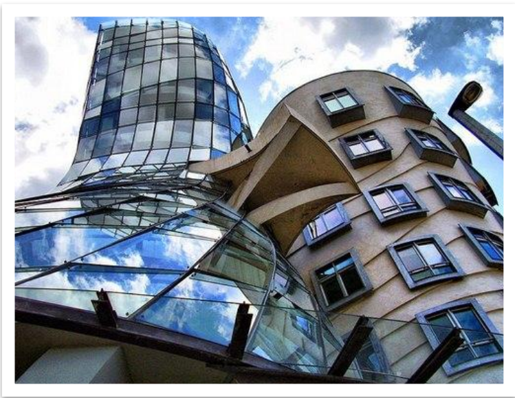
Танцующий дом" в Праге, Чехия, арх. Владо Милунич и Фрэнк Гэри