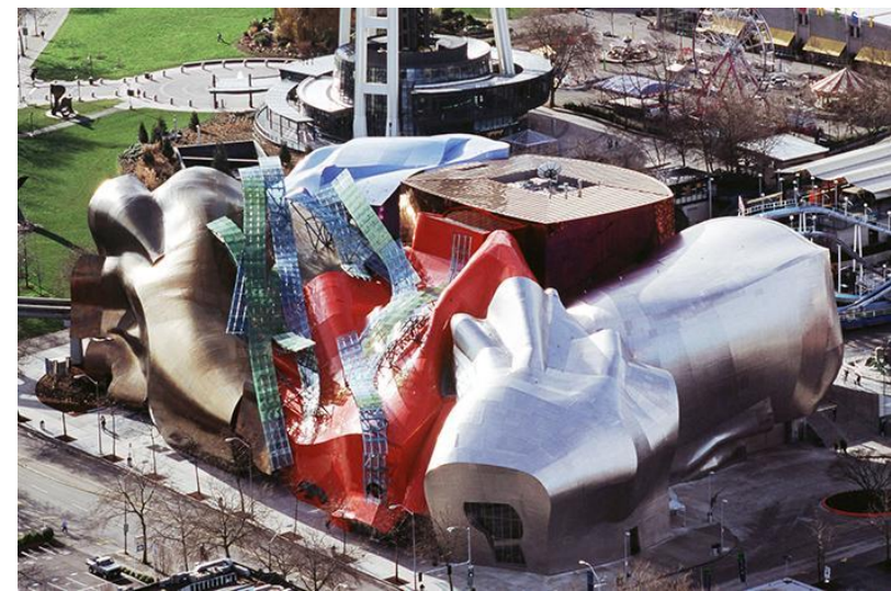
Музей музыки в Сиэтле, США, арх. Фрэнк Гери