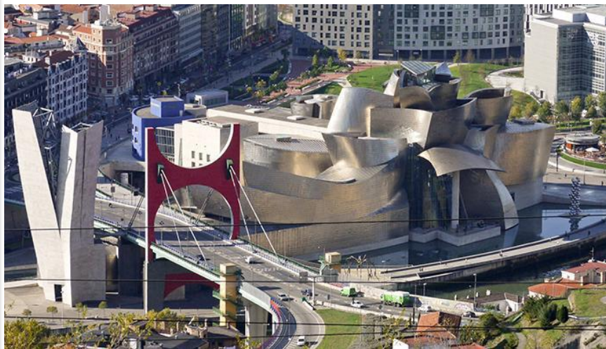
Музей Гугенхайма в Бильбао, Испания, арх. Фрэнк Гери