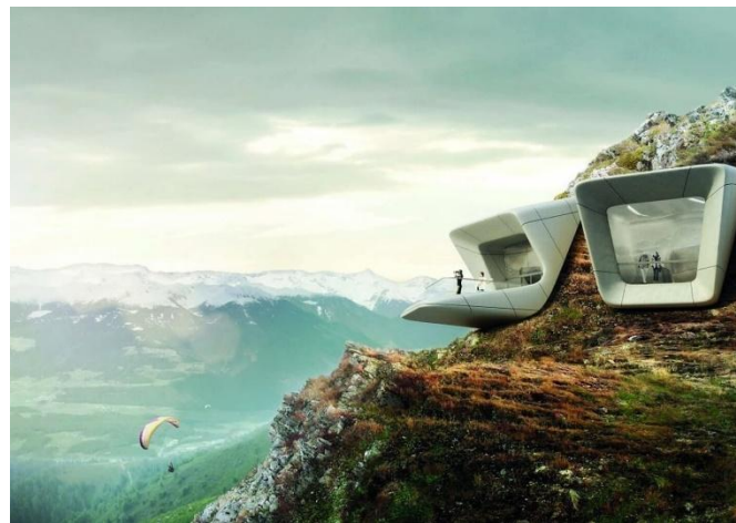
Горный музей Месснера, Италия, арх. Заха Хадид