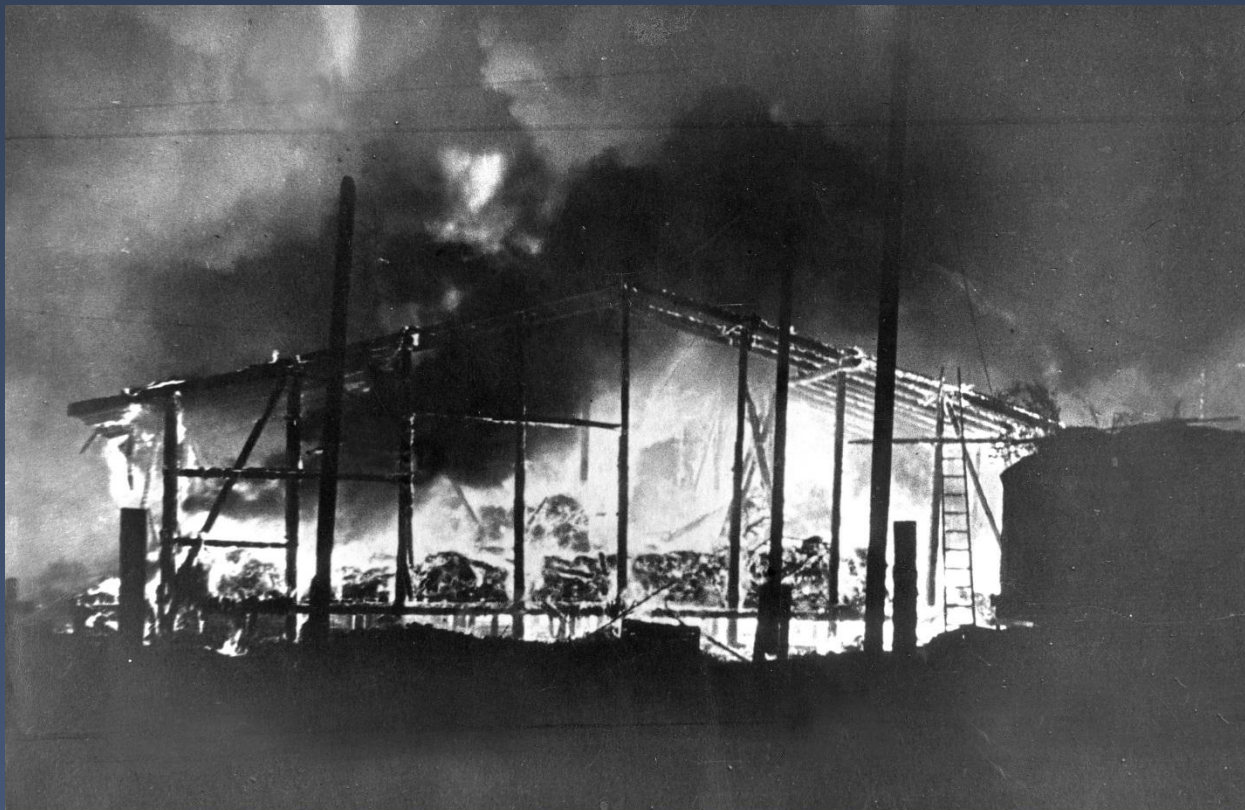
Пожар складов им. Бадаева 8 сентября 1941 год.