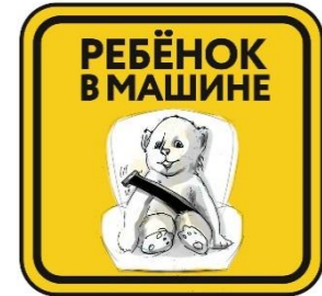
Материал: самоклеящаяся пленка

Опознавательной знак для автомобиля «Ребёнок в машине» (эскизы):