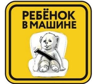
Материал: самоклеящаяся пленка

Опознавательной знак для автомобиля «Ребёнок в машине» (эскизы):