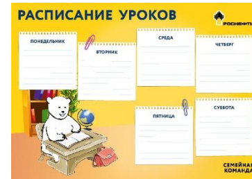
Материал: Мелованная бумага, 250 гр.

Опознавательной знак для автомобиля «Ребёнок в машине» (эскизы):