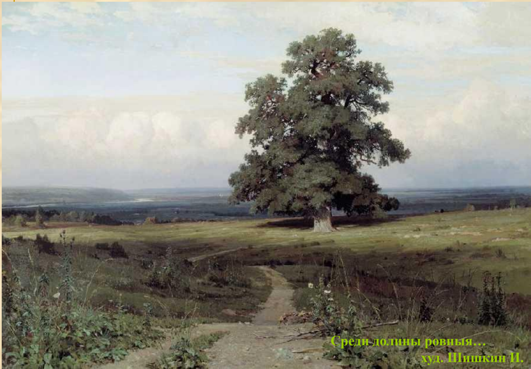
Среди долины ровныя... худ. Шишкин И.