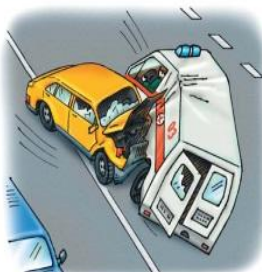
• транспортные катастрофы

Возникают в результате аварии или опасного техногенного происшествия, которое может повлечь или повлекло за собой человеческие жертвы, ущерб здоровью людей или окружающей природной среде, значительные материальные потери и нарушение условий жизнедеятельности. К техногенным чрезвычайным ситуациям относятся транспортные катастрофы, пожары, взрывы, аварии с выбросом радиоактивных веществ, гидродинамические аварии.