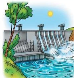
• гидродинамические аварии