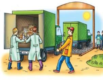
• инфекционная заболеваемость сельскохозяйственных животных