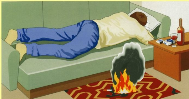
Курение в помещениях организации, а также курение в состоянии алкогольного опьянения.