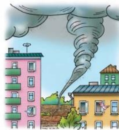
• опасные метеорологические явления и процессы