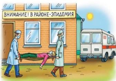
• инфекционная заболеваемость людей

Возникают в результате широкого распространения инфекционных болезней людей, сельскохозяйственных животных и растений, когда нарушаются нормальные условия жизнедеятельности, возникает угроза жизни и здоровью людей, происходит падеж скота и гибель растений.