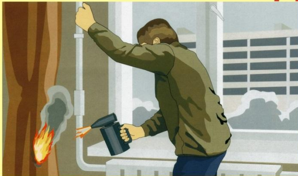
Отогревание замерзших труб паяльными лампами и факелами и другие работы открытым огнем.

На территории Республики Башкортостан расположены 116-пожароопасные, 20320- взрывоопасные, 1756-взрывопожароопасные объекты. Ежегодно в республике происходит более 4500 пожаров. В огне погибают около 400 человек.