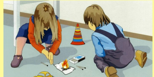
Детская шалость, неконтролируемость огневых работ и другие подобные причины.