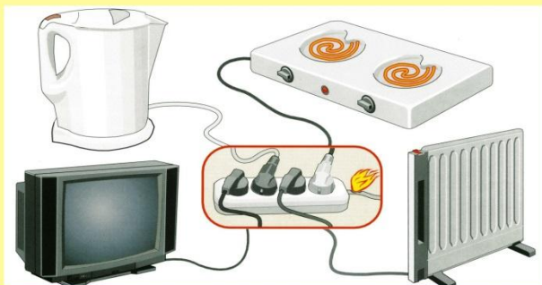
Неисправная электропроводка, электроизоляция, перегрузка электросети.