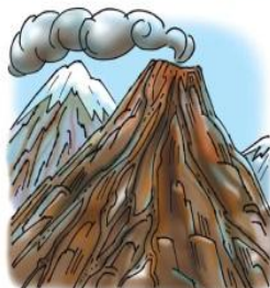
• опасные геологические явления и процессы

Возникают в результате опасного природного явления или стихийного бедствия, которое может повлечь или повлекло за собой человеческие жертвы, значительные материальные потери и нарушения условий жизнедеятельности, нанести ущерб здоровью людей или окружающей природе. К природным чрезвычайным ситуациям относятся опасные геологические, гидрологические, метеорологические явления и процессы, а также природные пожары.