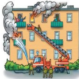
• пожары, взрывы