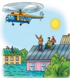
• опасные гидрологические явления и процессы