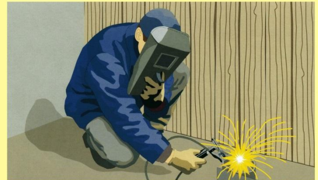
Нарушение правил проведения сварочных работ и другие аналогичные причины

Основными причинами пожаров являются: -неосторожное обращение с огнем более 1200пож.; -неисправность электрооборудования более 900п. -установленные поджоги около 600 пожаров; -нарушение правил эксплуатации печей более 300п -наруш.правил эксплуат. транс. средств 300 пож.; -нарушение правил эксплуатации электробытовых приборов около 200, газовых устройств более 100, правил сварочных и огневых работ около 100 пожаров и другие нарушения пожарной безопасности.