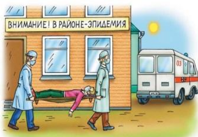
• инфекционная заболеваемость людей

Возникают в результате широкого распространения инфекционных болезней людей, сельскохозяйственных животных и растений, когда нарушаются нормальные условия жизнедеятельности, возникает угроза жизни и здоровью людей, происходит падеж скота и гибель растений.