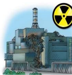
• аварии с выбросом радиоактивных веществ