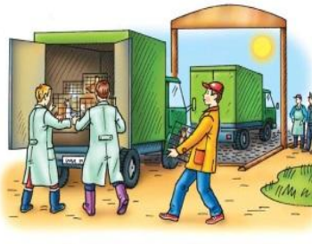
• инфекционная заболеваемость сельскохозяйственных животных