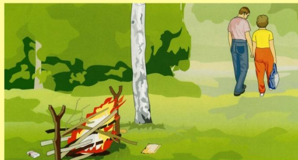
Разведение костров, поджигание сухой травы, мусора вблизи зданий и сооружений.