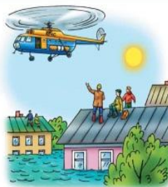
• опасные гидрологические явления и процессы