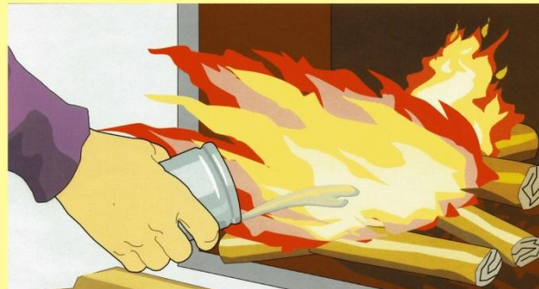
Умышленный поджог, применение для розжига легковоспламеняющихся горючих жидкостей.