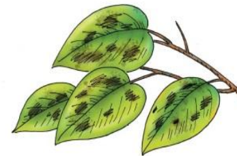
• поражения сельскохозяйственных растений болезнями и вредителями