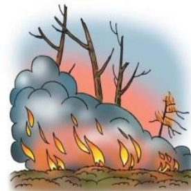
• природные пожары