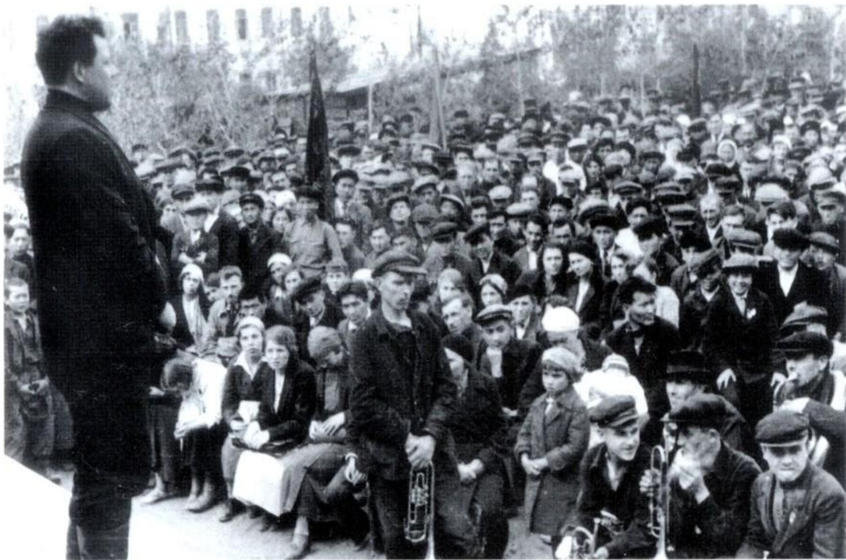
Первый день войны... Митинг в Павлодаре 22 июня 1941 года. Парк им. Ленина.