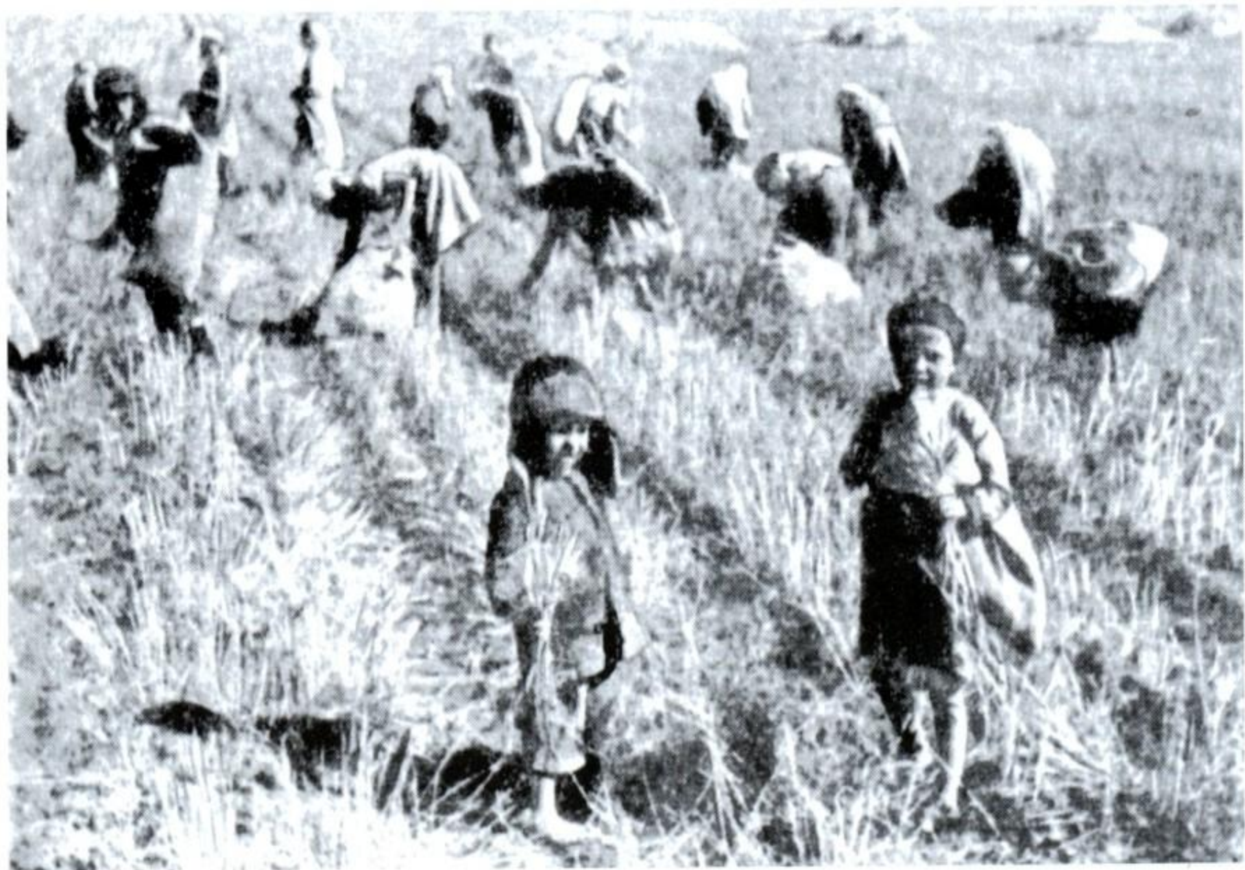
Дети собирают колоски. 1943г.