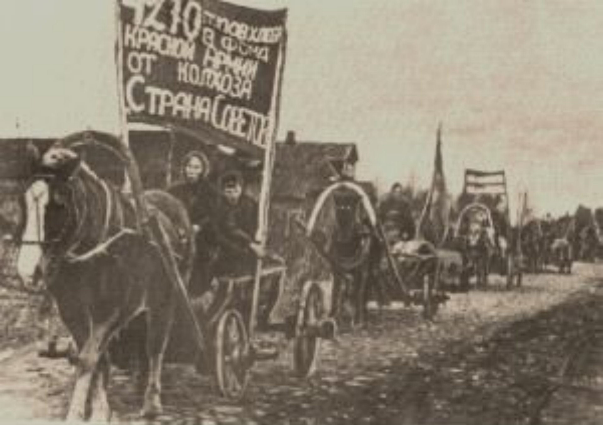
Слача хлеба для Красной армии