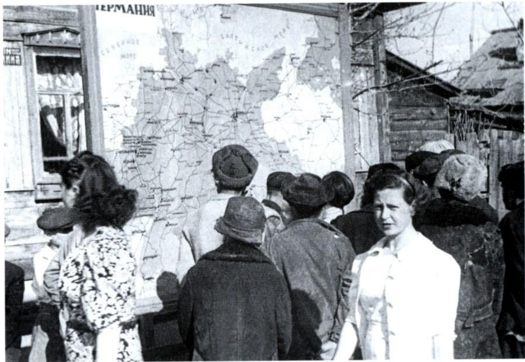
У карты Германии.