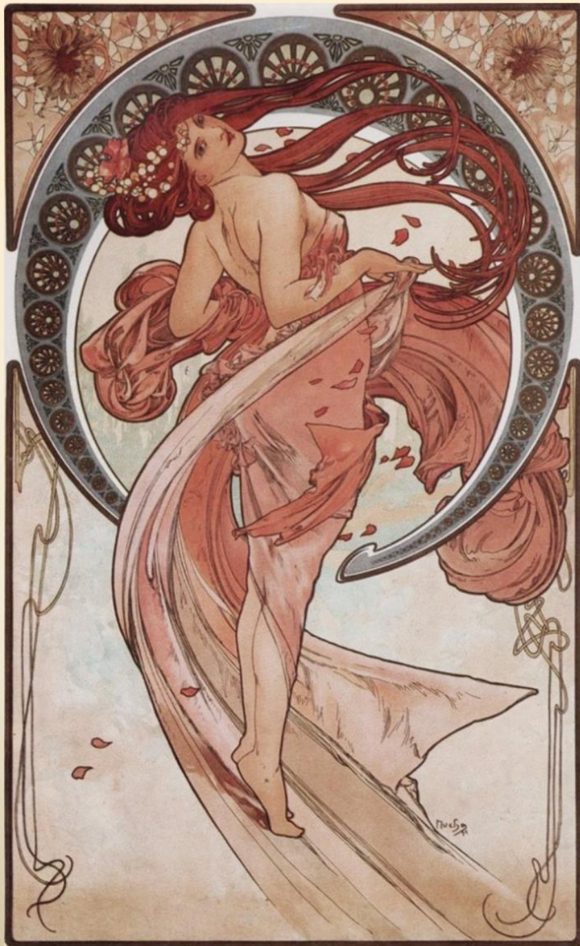
А. Муха. Танец (из серии искусство)