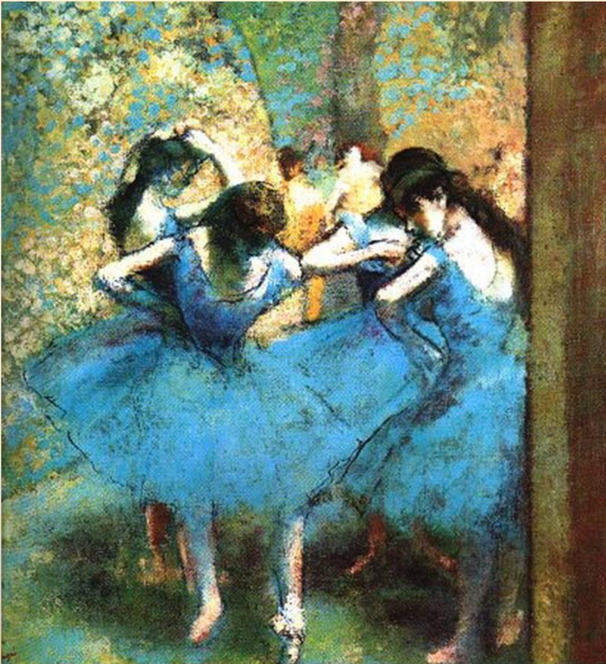
Танцовщицы на поклонах