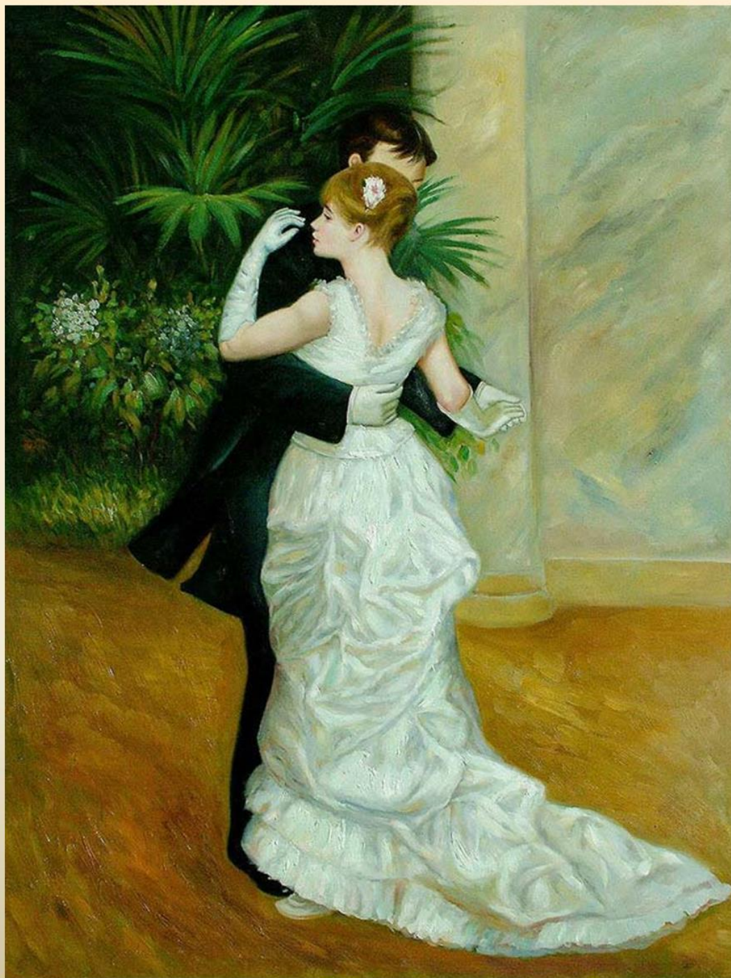
О. Ренуар. Танец