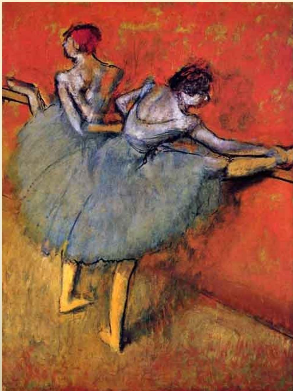
Танцовщицы у станка