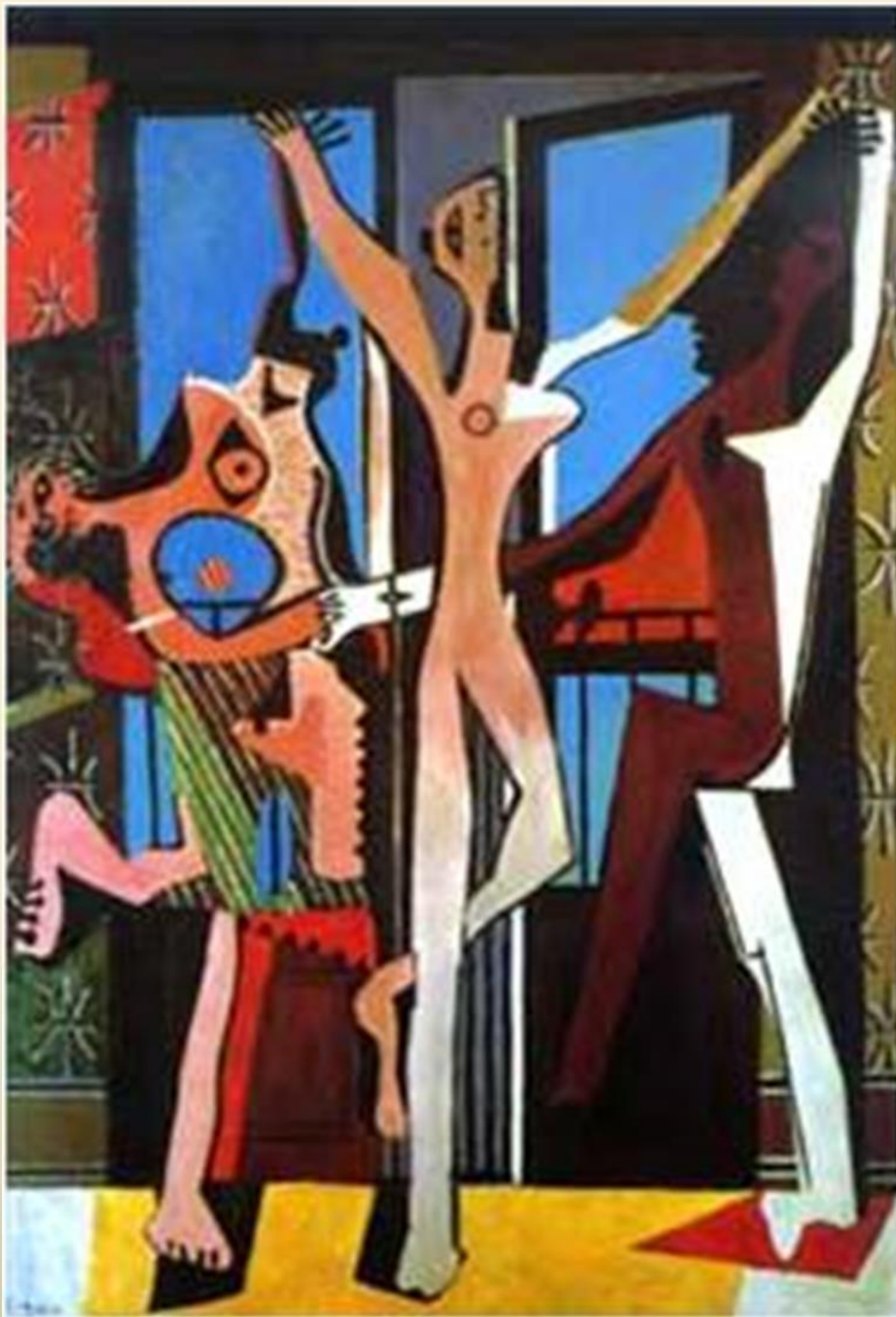
Пикассо. Три танцовщицы