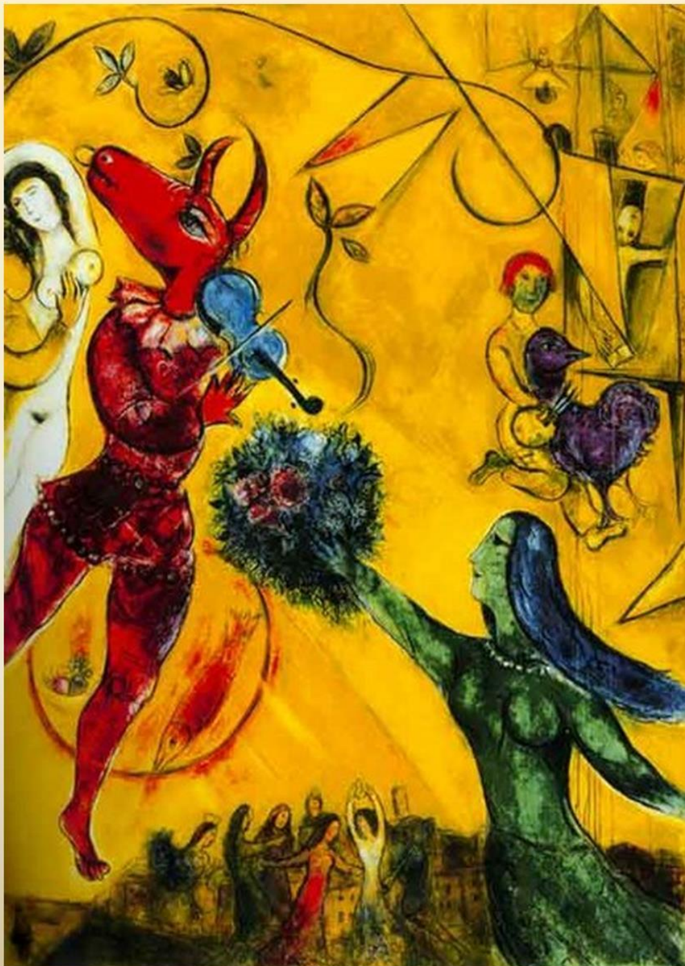
М. Шагал. Танец