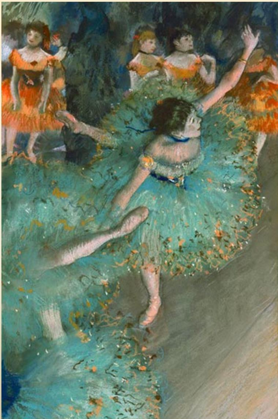
Танцовщицы в зеленом