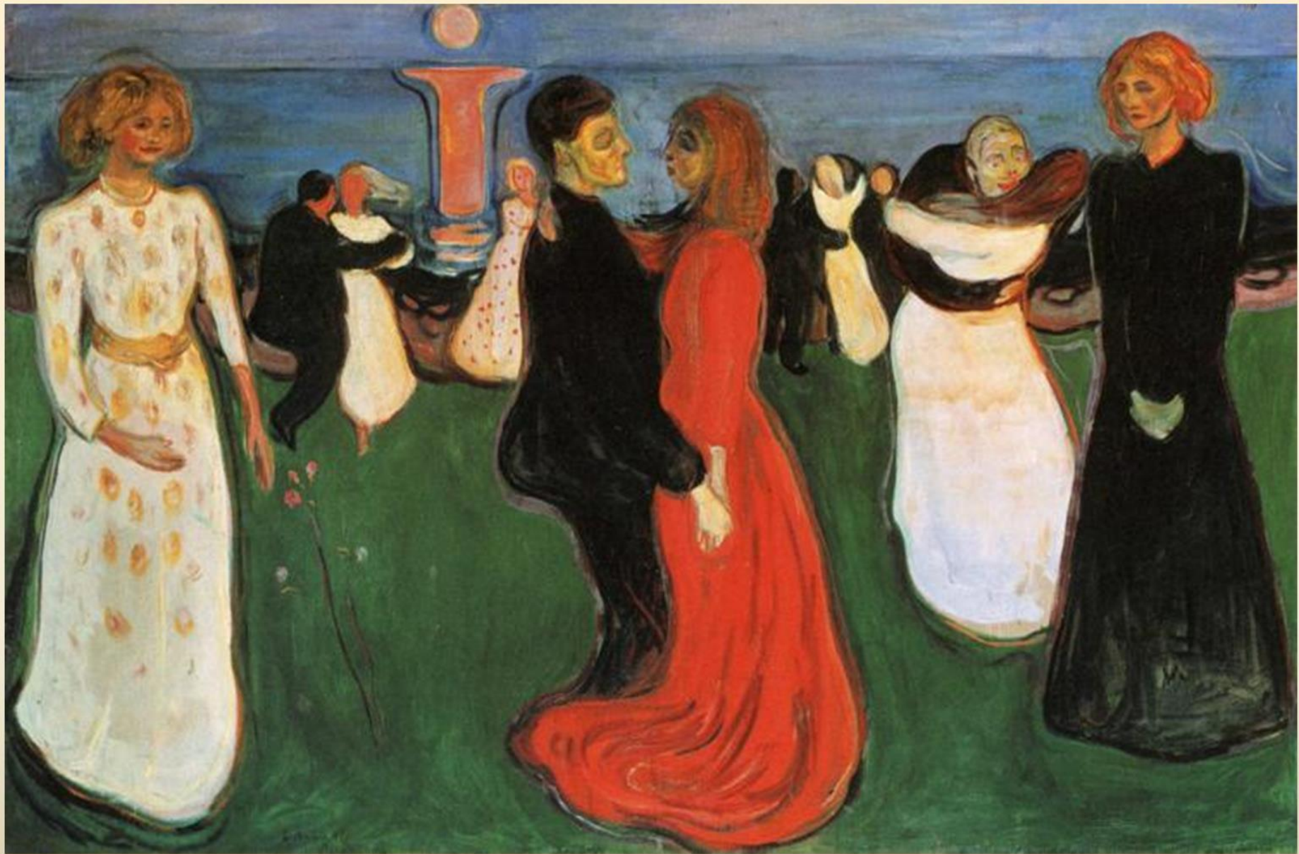
Э. Мунк. Танец жизни