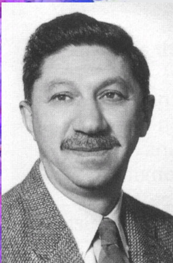
Абрахам Маслоу (1908-1970)