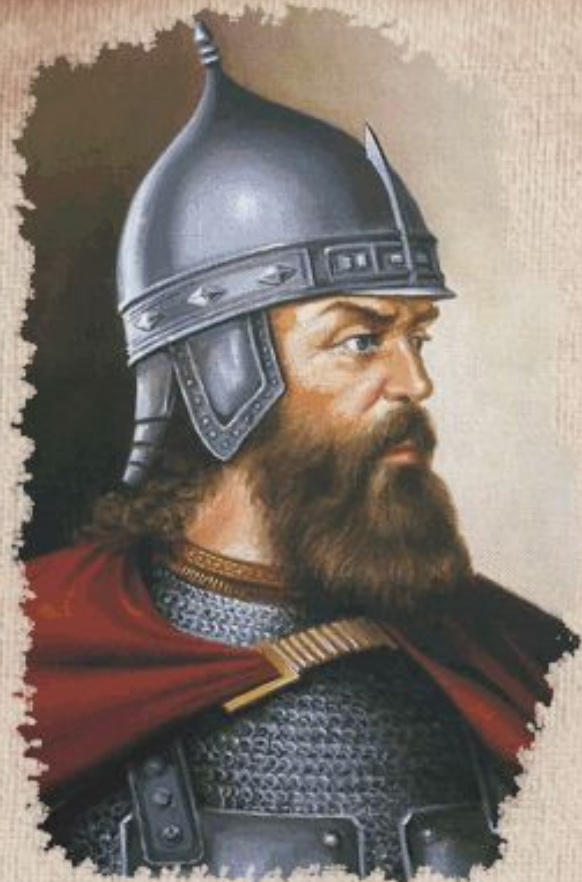
Дмитрий Донской 1350-1389 гг.

8 сентября 1380 года состоялась знаменитая Куликовская битва, которая закончилась полным разгромом татаро-монгольского войска. На битву русские полки вел великий князь Московский и Владимирский Дмитрий Иванович, позднее прозванный Донским. Куликовская битва положила начало освобождению Руси от татаро-монгольского ига. День победы на Куликовом поле стал Днем воинской славы России, который отмечается ежегодно 21 сентября.