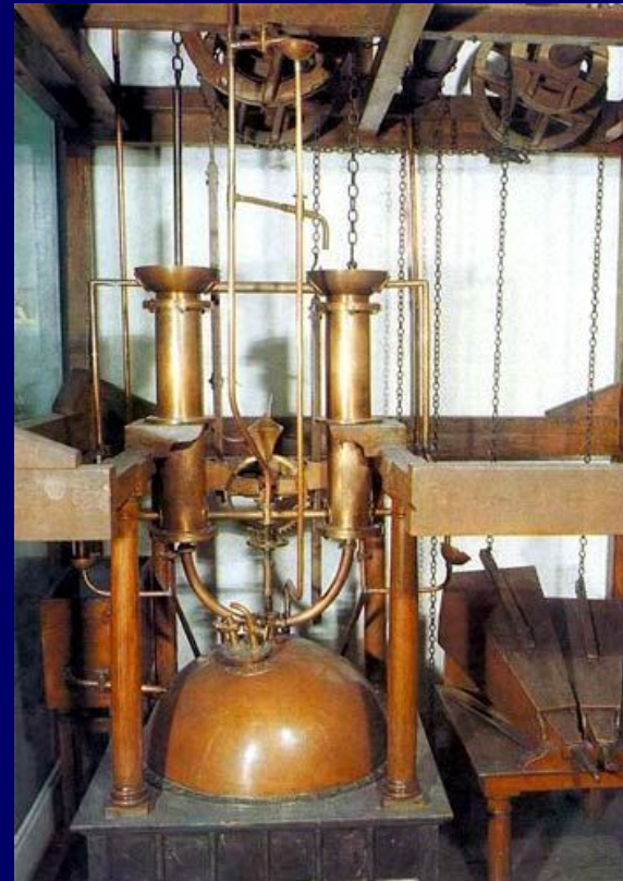
Макет паровой машины И.И. Ползунова - Краеведческий музей Барнаула