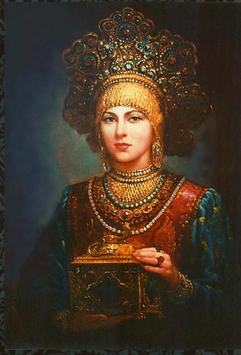
«Ларец» Художник Андрей Шишкин