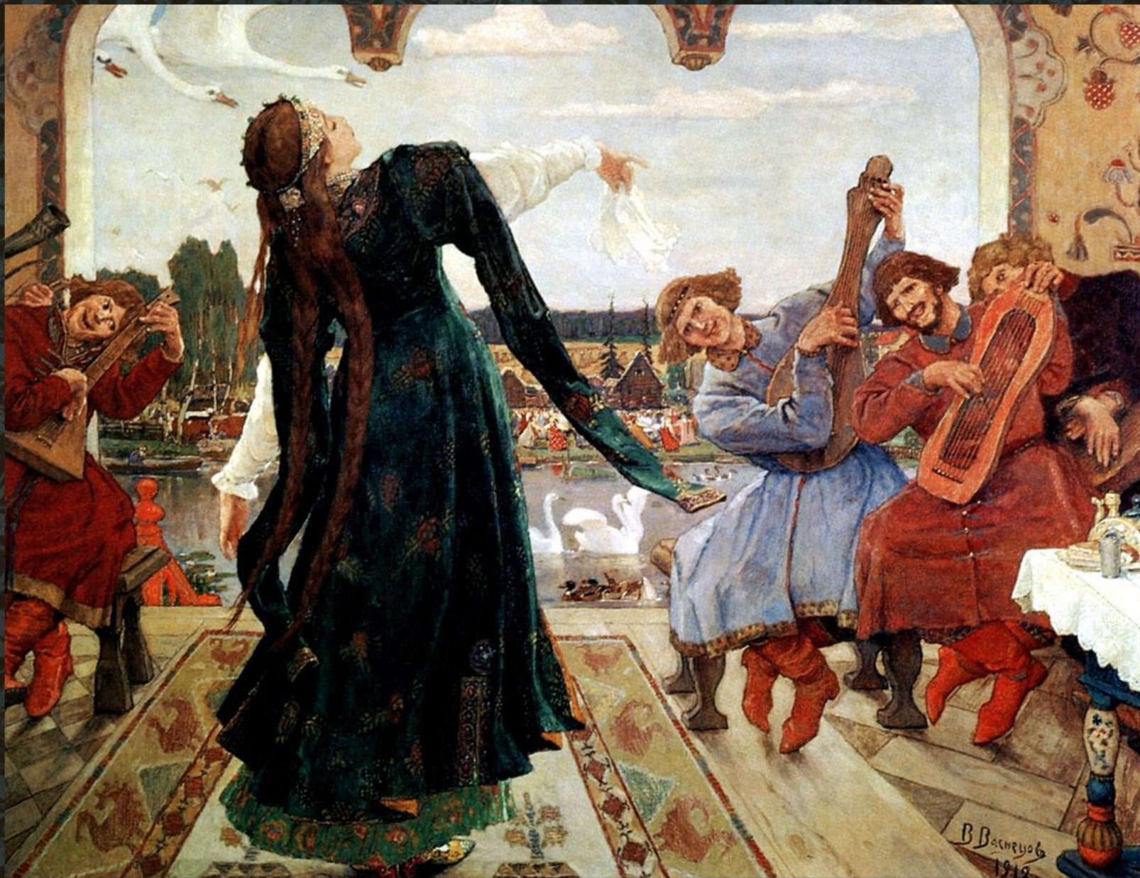
«Василиса Примудрая» Художник: Виктор Васнецов