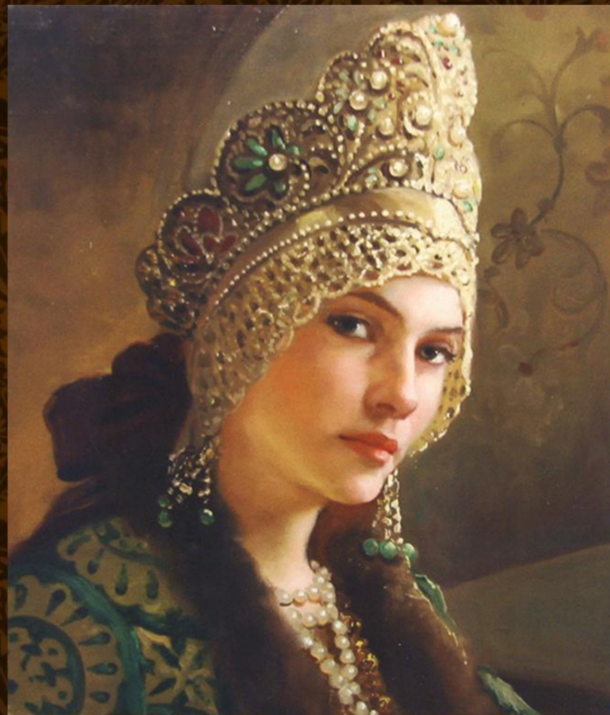
ОБРАЗ БОЯРСКОЙ ДОЧКИ