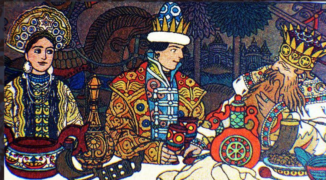
Иллюстрация с сказке А.С.Пушкина « Сказочная шкатулка» Художник Иван Билибин