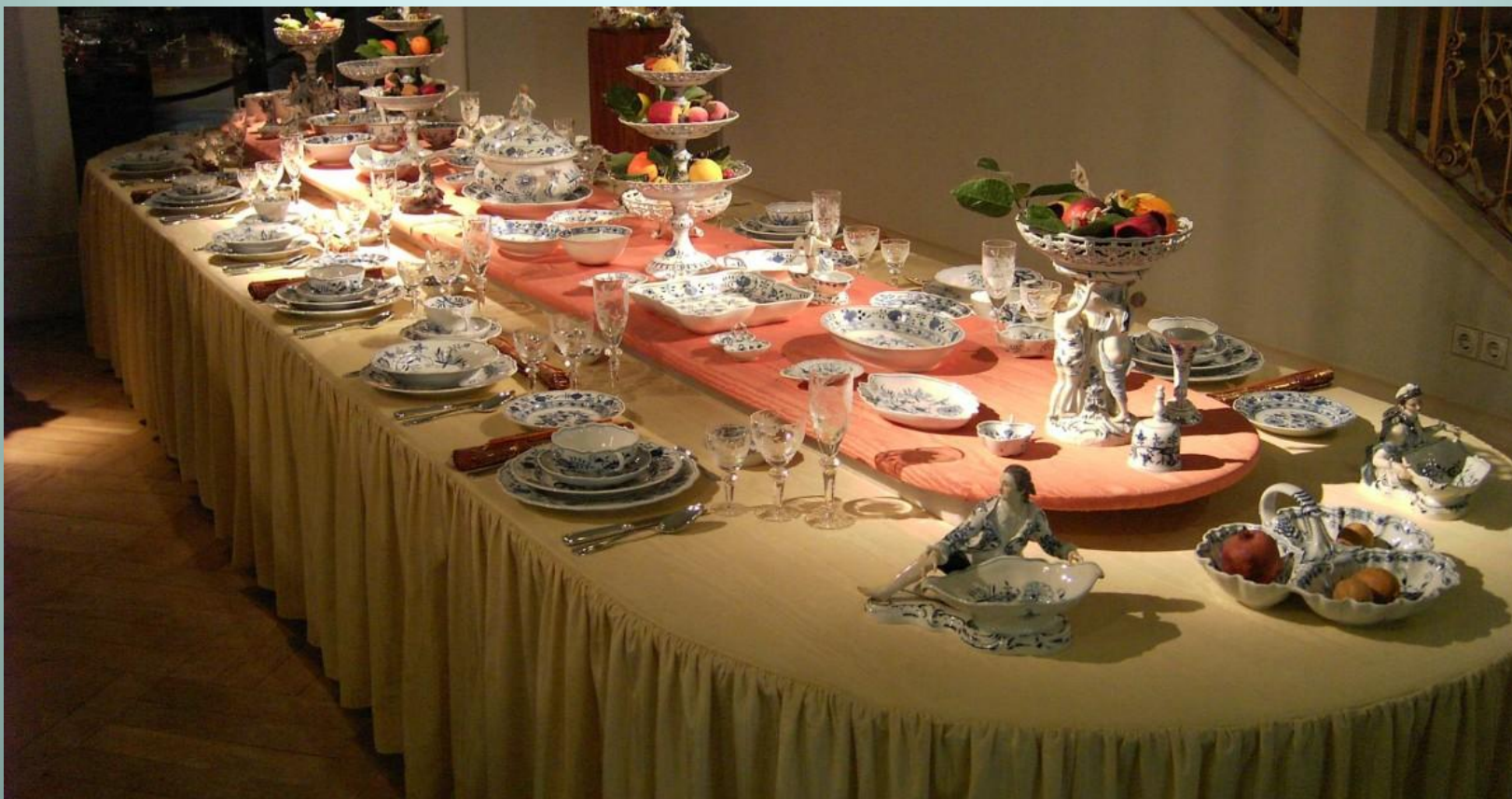
Сервировка обеденного стола.