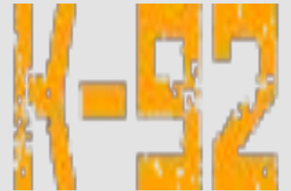
Предыдущий логотип выглядит так (рис.1)

Лого выглядит скучно, не имеет динамики, эффекты добавленные на символы выглядят уныло и не эффектно. В логотипе читается старость.