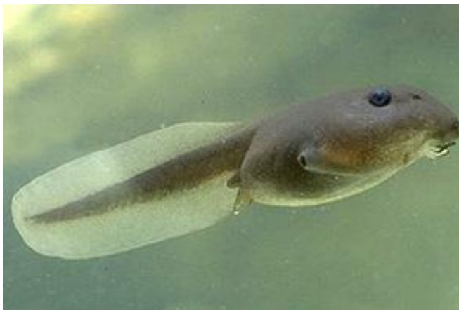
Головастик зеленой жабы