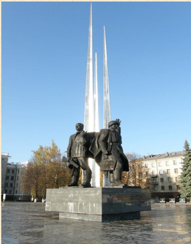
Памятник защитникам города Тулы. ( Три штыка )