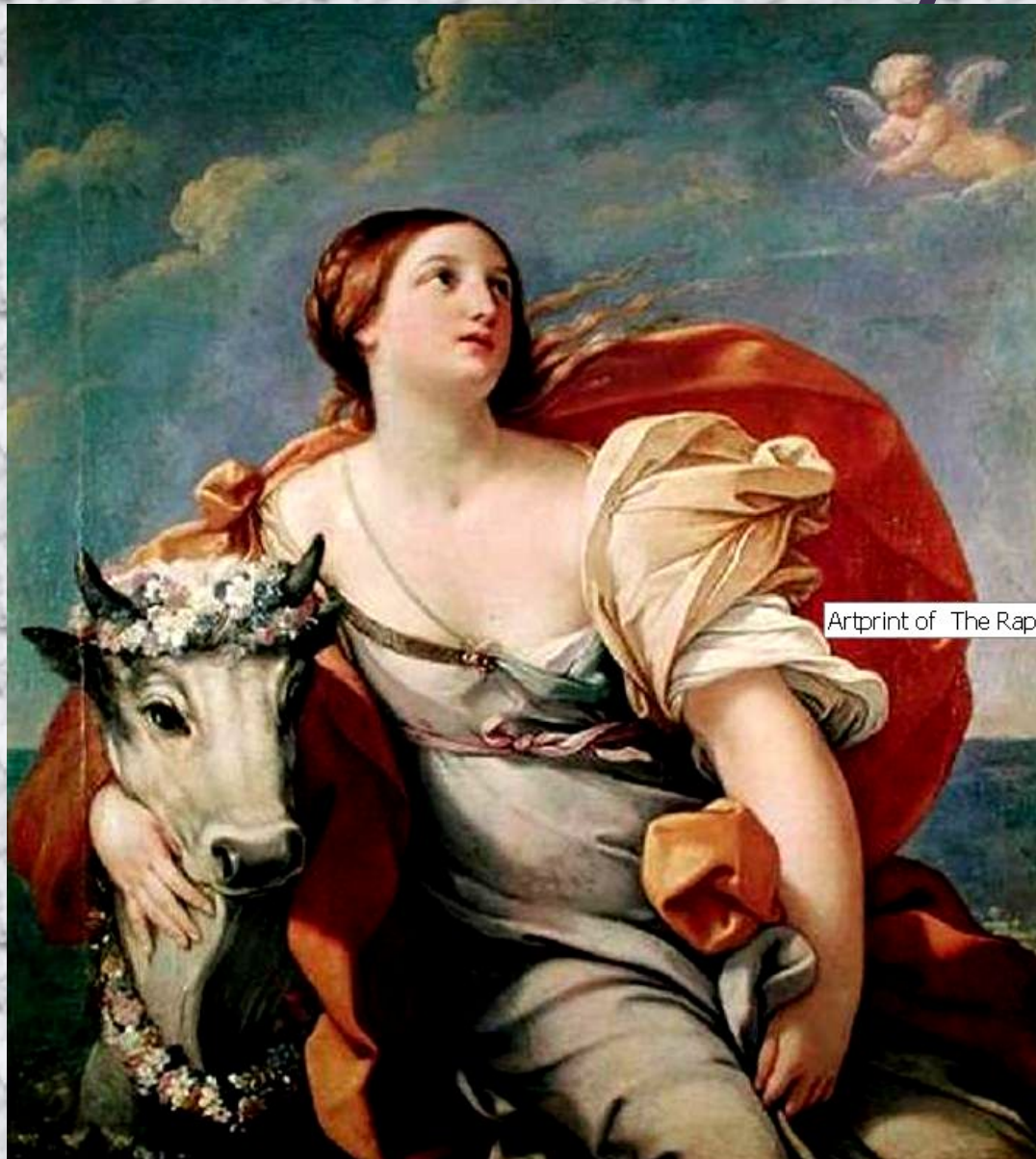
Artprint of The Rape