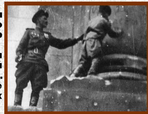
У стен Рейхстага

Список детей - участников войны - не может уместиться в один рассказ: Зина Портнова, Валя Котик, Костя Кравчук, Василий Коробко, Надежда Богданова, Марат Казей и сотни других имён. Подвиг каждого из них не оценить словами. Дети, даже самые маленькие, выросли на глазах. Им довелось увидеть смерть своих родных, близких, на себе ощутить голод и холод.