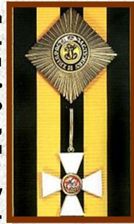
Орден св.Георгия I ст.