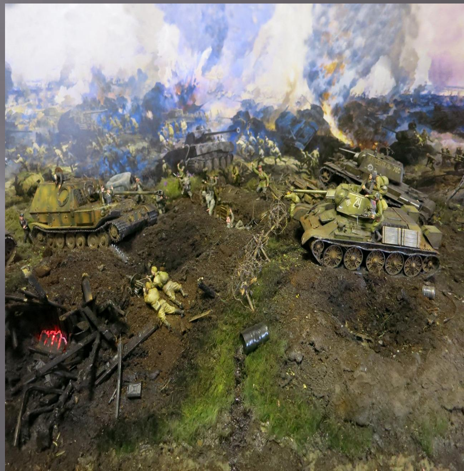
Диорама этих событий.