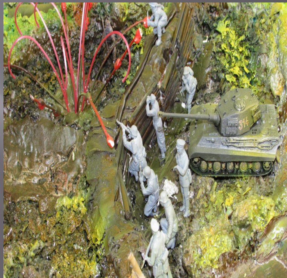
Сосредоточение в окопах Советских войск