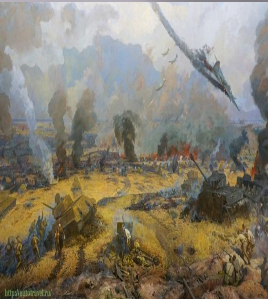
События тех дней на холсте художников.