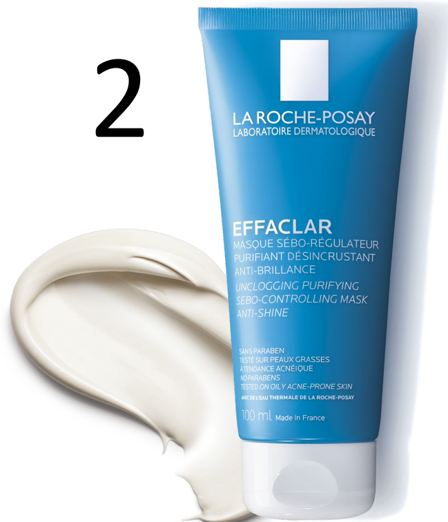
МАСКА Ефаклар для глибокого очищення