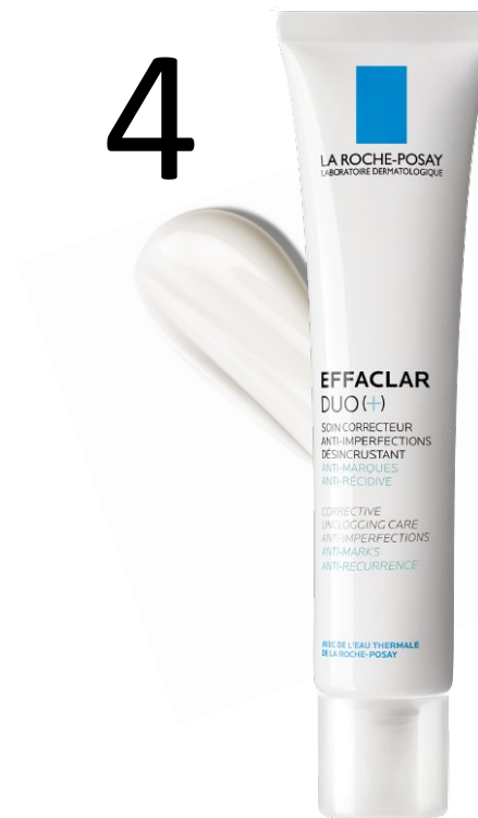
ДОГЛЯД Ефаклар Дуо (+) Комплексний корегуючий засіб