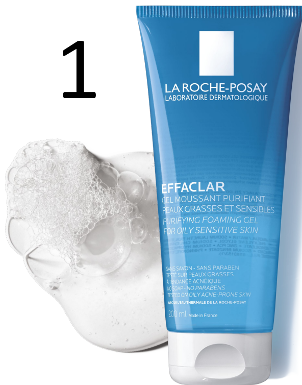
ОЧИЩЕННЯ Гель-мус Ефаклар