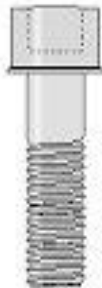
Болт с внутренним шестиугольником