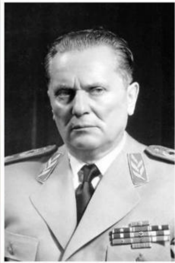
Иосип Броз Тито

Из всех стран социалистического лагеря только Югославия (с 1963 г. – Социалистическая Федеративная Республика Югославия (СФРЮ)) была практически единственной, на которую не распространялось советское влияние. Лидером страны с конца Второй мировой войны до 1980 г. являлся Иосип Броз Тито (президент страны с 1953 г.). Коммунистическая партия Югославии (Союз коммунистов Югославии) во главе с Тито противостояла идеологическому и политическому давлению СССР и предложила собственную модель строительства социалистического общества. Тито считал, что не внешние силы, а само государство должно определять пути построения коммунизма. За весь период его правления Югославия проводила политику неприсоединения и не участвовала в СЭВ и ОВД, придерживалась нейтралитета в «холодной войне».