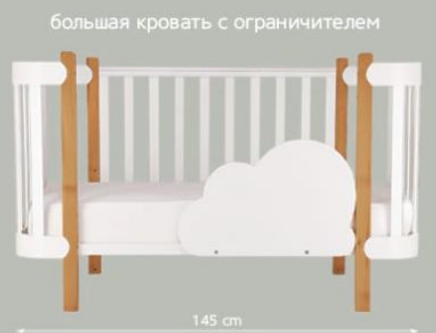
большая кровать с ограничителем