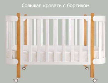
большая кровать с бортиком