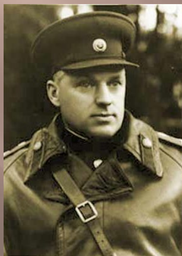
К. К. Рокоссовский – Центральный фронт

Ставка Верховного Главнокомандования, своевременно и верно определив замысел противника, приняла решение: перейти к преднамеренной обороне на заранее подготовленных рубежах, в ходе которой обескровить ударные группировки немецких войск, а затем перейти в контрнаступление и завершить их разгром. Произошел редчайший в истории войны случай, когда сильнейшая сторона, имевшая все необходимое для наступления, выбрала из нескольких возможных наиболее оптимальный вариант своих действий.