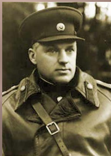
К. К. Рокоссовский – Центральный фронт

Ставка Верховного Главнокомандования, своевременно и верно определив замысел противника, приняла решение: перейти к преднамеренной обороне на заранее подготовленных рубежах, в ходе которой обескровить ударные группировки немецких войск, а затем перейти в контрнаступление и завершить их разгром. Произошел редчайший в истории войны случай, когда сильнейшая сторона, имевшая все необходимое для наступления, выбрала из нескольких возможных наиболее оптимальный вариант своих действий.