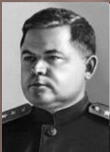
Н. Ф. Ватутин – Воронежский фронт