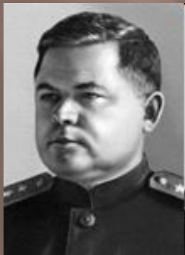
Н. Ф. Ватутин – Воронежский фронт