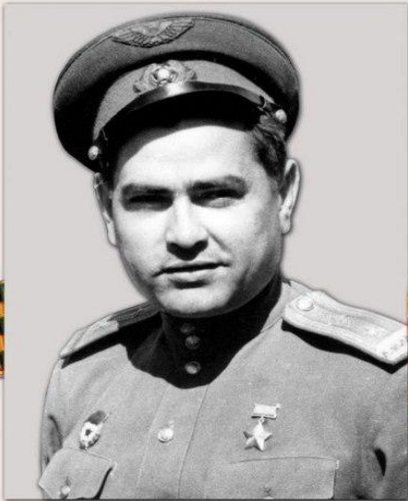
МАРЕСЬЕВ АЛЕКСЕЙ ПЕТРОВИЧ