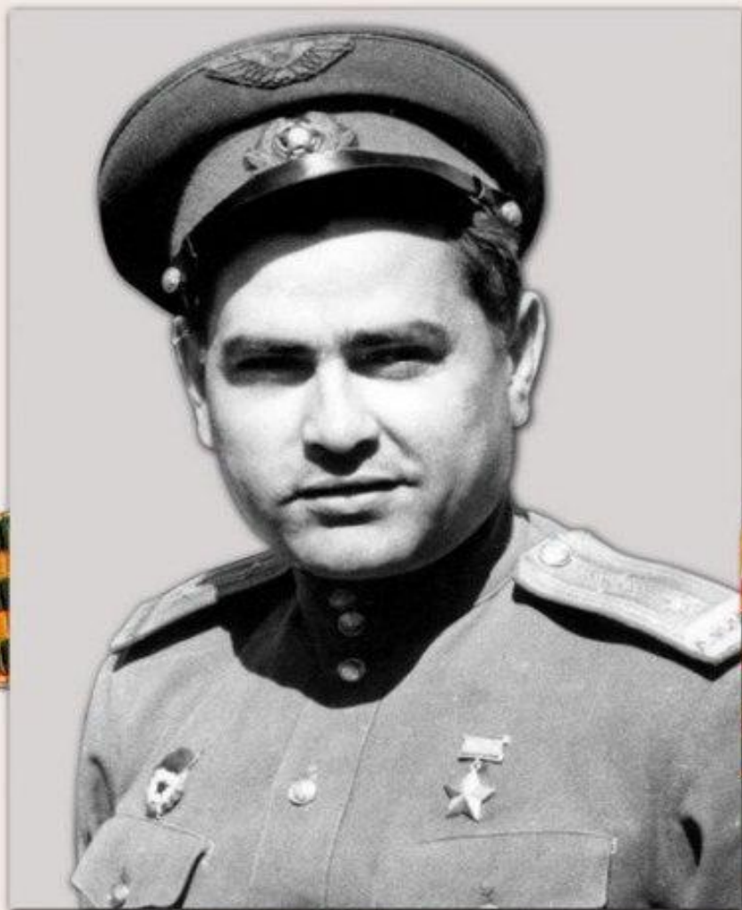
МАРЕСЬЕВ АЛЕКСЕЙ ПЕТРОВИЧ