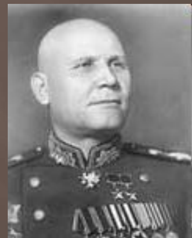
И. С. Конев – Степной фронт