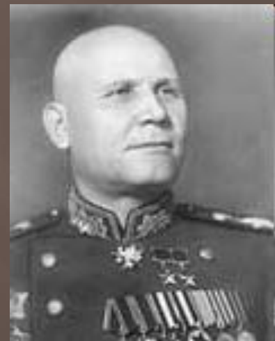
И. С. Конев – Степной фронт