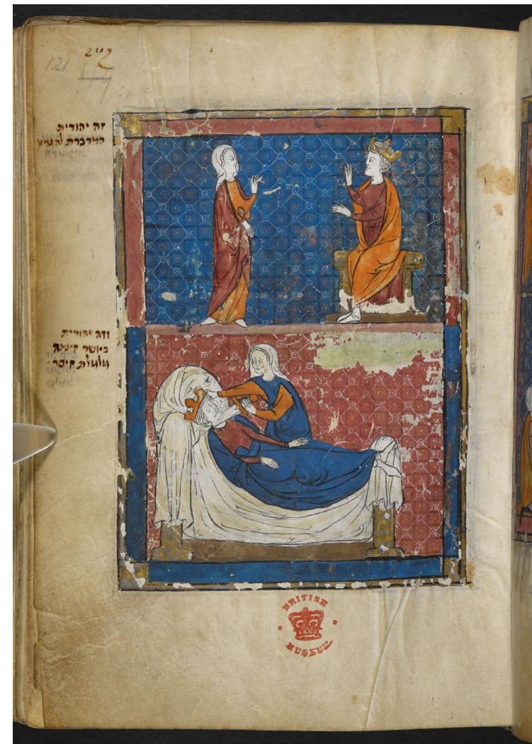
Ротшильдский сборник (слева, ок.1470 г., f.217r) и Северофранцузский сборник (справа, f.121r)