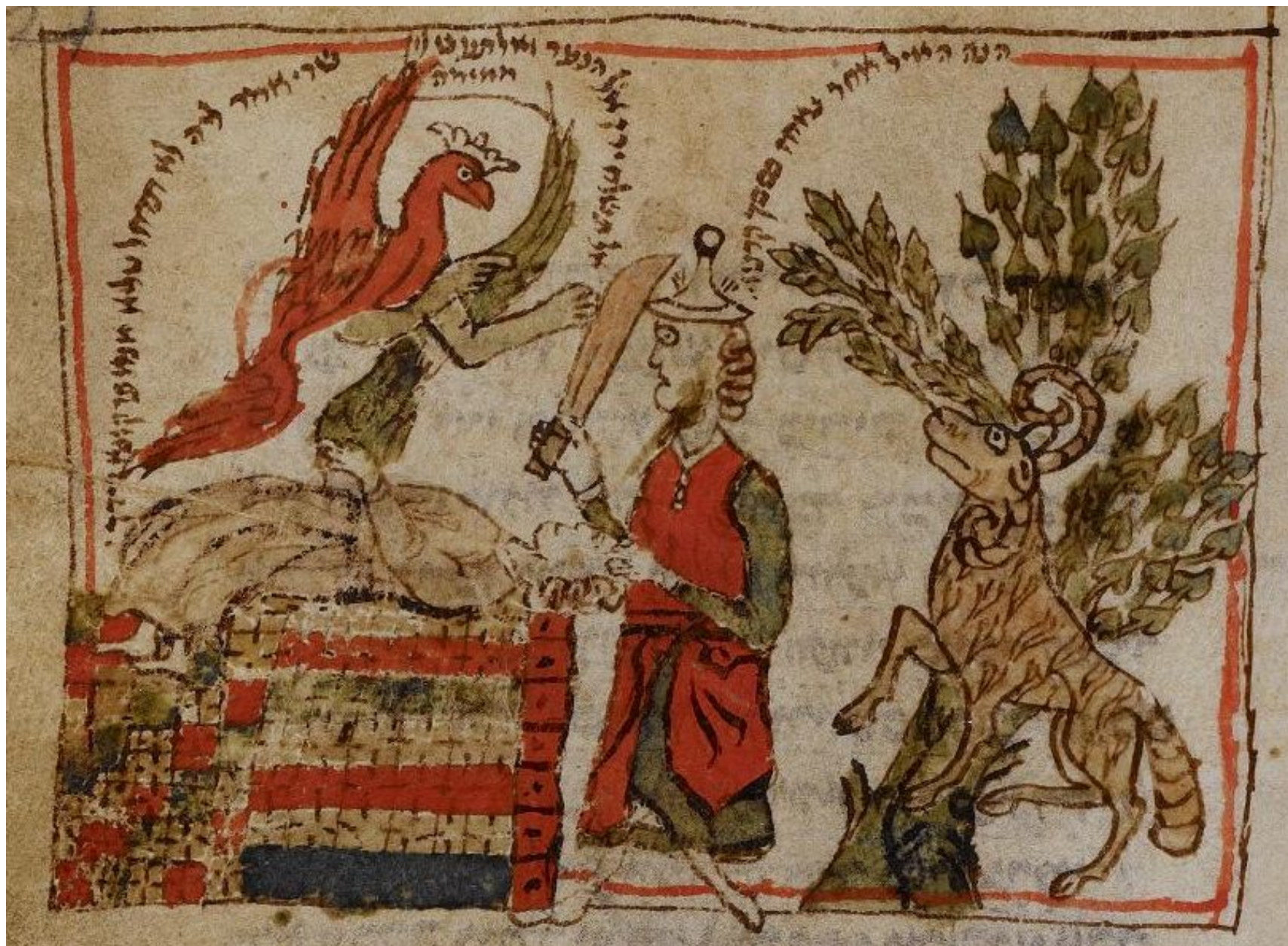
Малый Ашкеназский махзор, ок.1300 г., f.121r