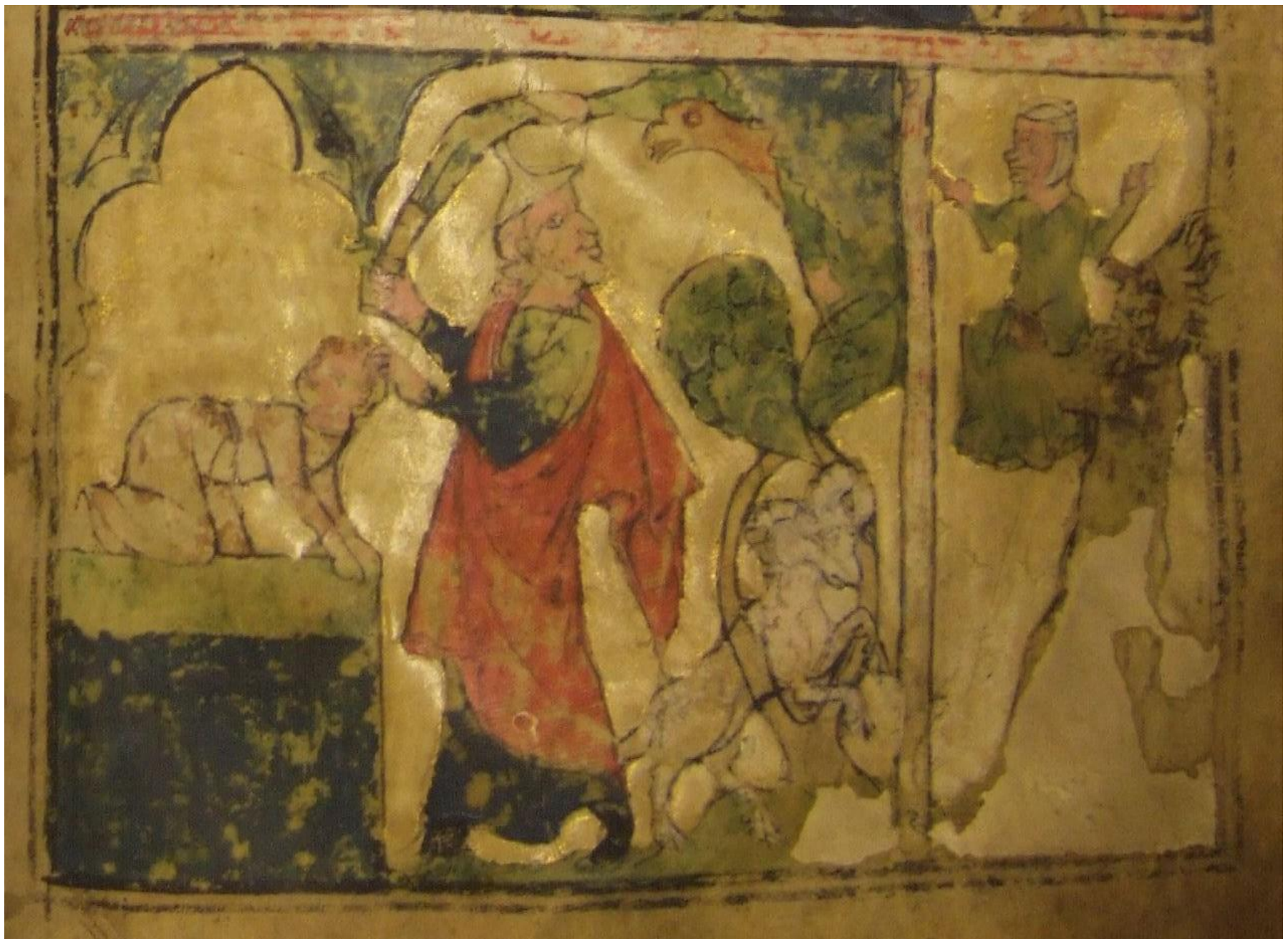
Регенбургское Пятикнижие, ок.1300 г., f.18v