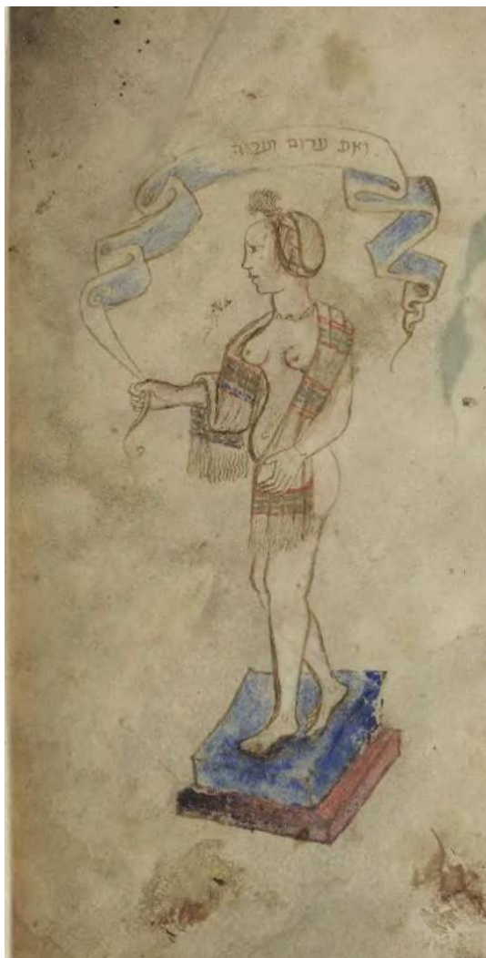
Агада Мёрфи, fol. 10r.