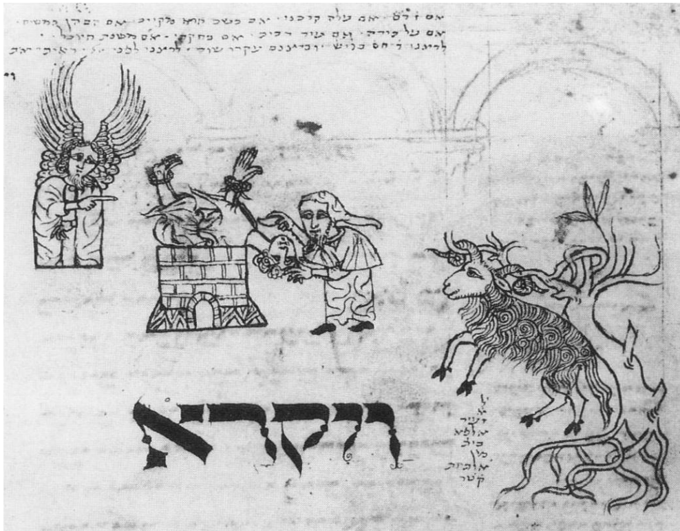
Северофранцузский сборник (справа, 1277-86, f.521v) и Пятикнижие из Бодлеанской библиотеки (наверху, 1340 г., f.120r)