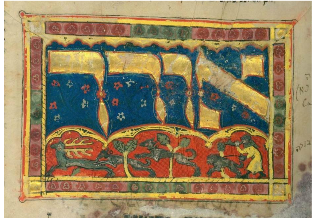
Трехчастный махзор из собрания Кауфмана, ок.1322 г., fol.18r