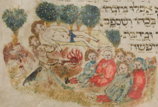
Мученическая смерть матерей, которые обрезали своих сыновей, Елеазара и матери с семи сыновьями. F.79r

טביעה ותקוה ארמו דמינמו היעיה וילת באש נה בשוא נתעה ועל לא גמל מזהר ודמקו בעשיה תבל נפרו וטספכ נבל מאבדות דורו ונהגת עשת פאר ריתח ויפשו