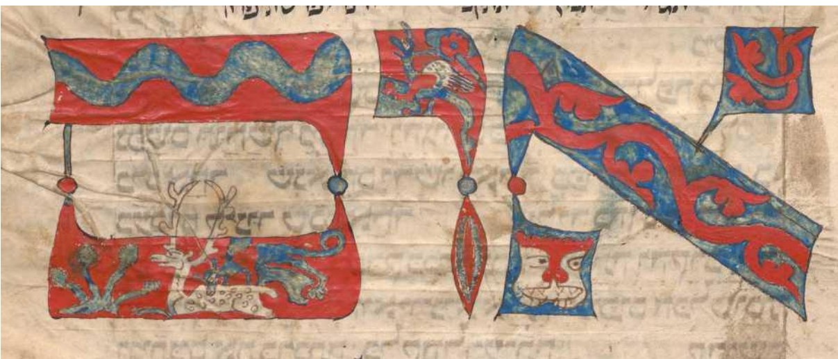
Охота на оленя в Вормсском махзоре (внизу, f.130v), Мюнхенском махзоре (вверху, кон.XIII в., f.37v), Венском махзоре (справа, 1-я пол.XIV в., f.172v)