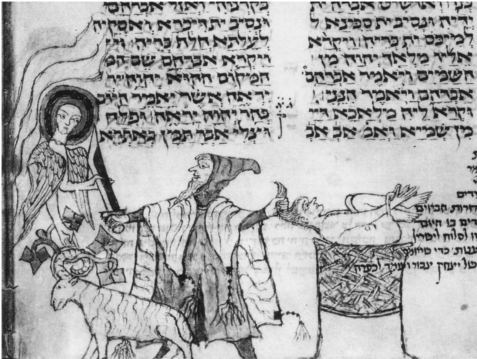
Богослужбное Пятикнижие Леви (1309 г., f.34v)