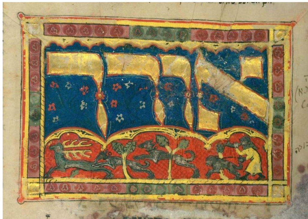
Трехчастный махзор из собрания Кауфмана, ок.1322 г., fol.18r