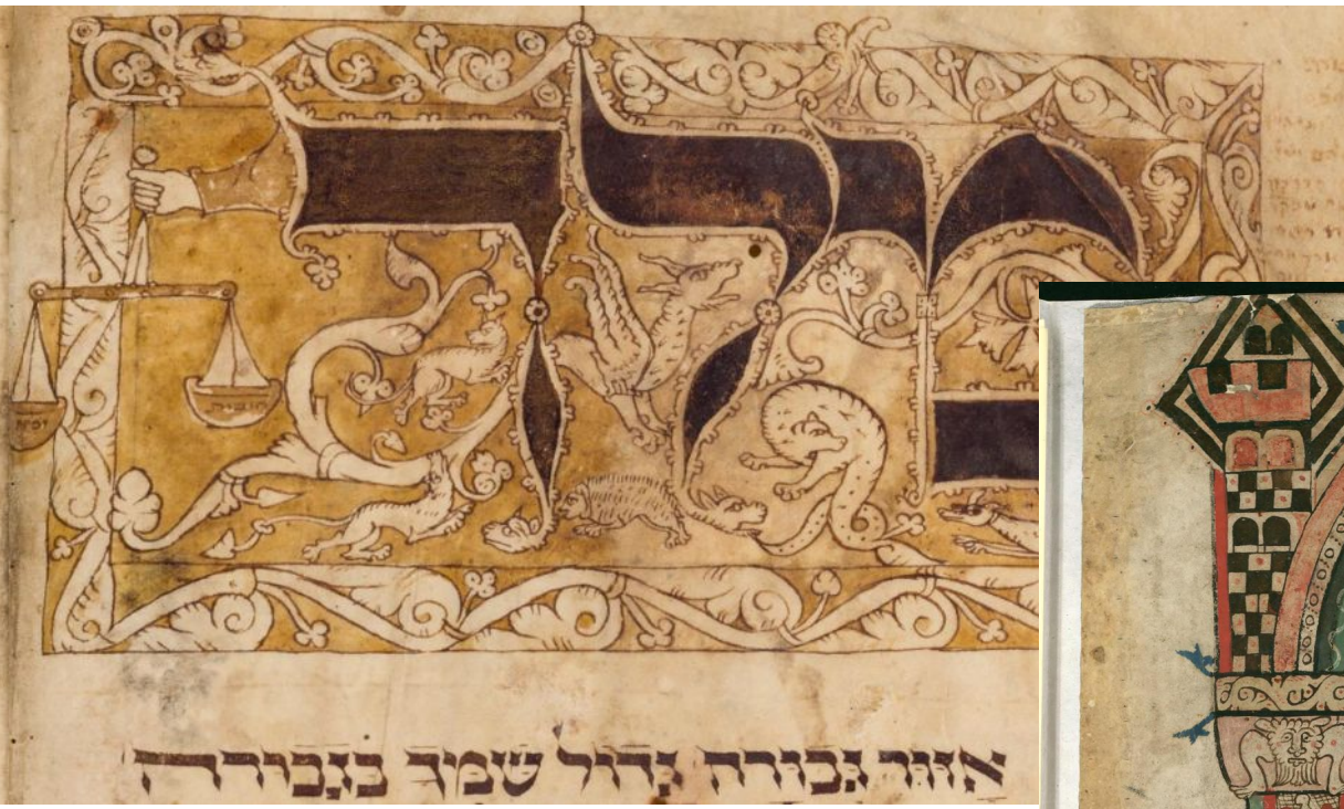
Весы в Вормсском махзоре (справа, 1272 г., f.1v) и в Венском махзоре (1-я пол.XIV в., f.1v)