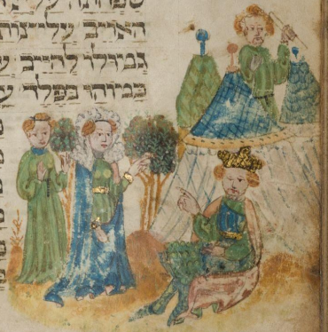
История Юдифи. Ff.80v - 81r

פיז ניה הרבו השמיצני פ'נתהמה ממטפחת נביאים אנו פותרים עלוד מלכי וק'צני פתע פתאום כמ'א ה מחר פגוזר יתצו העיר כפ'ר ה פסעהו לבשרה ואל האבן פ'דה ה בר'רבר כמ'א ומ'ת'ר פ'קוד כפ'קוד