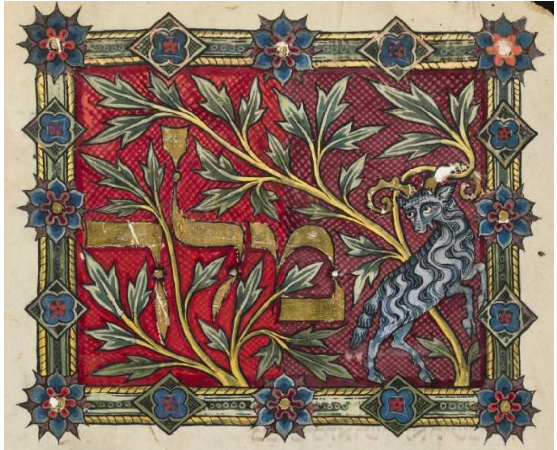
Лейпцигский махзор (слева, f.26v) и Трехчастный махзор из Бодлеанской библиотеки (справа, ок.1322 г., f.5v)