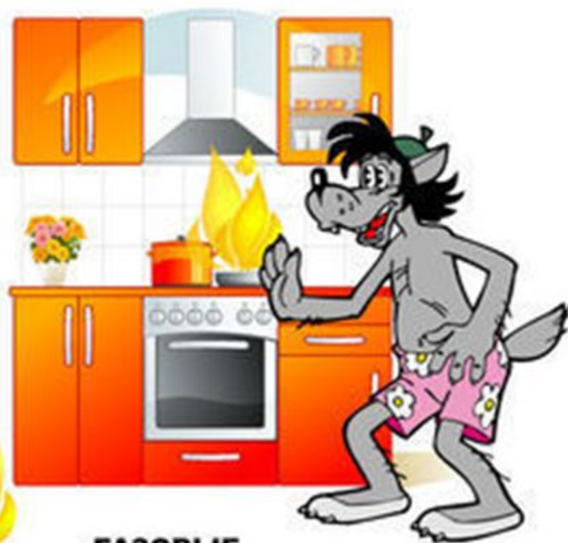
ГАЗОВЫЕ И ЭЛЕКТРИЧЕСКИЕ ПЕЧИ