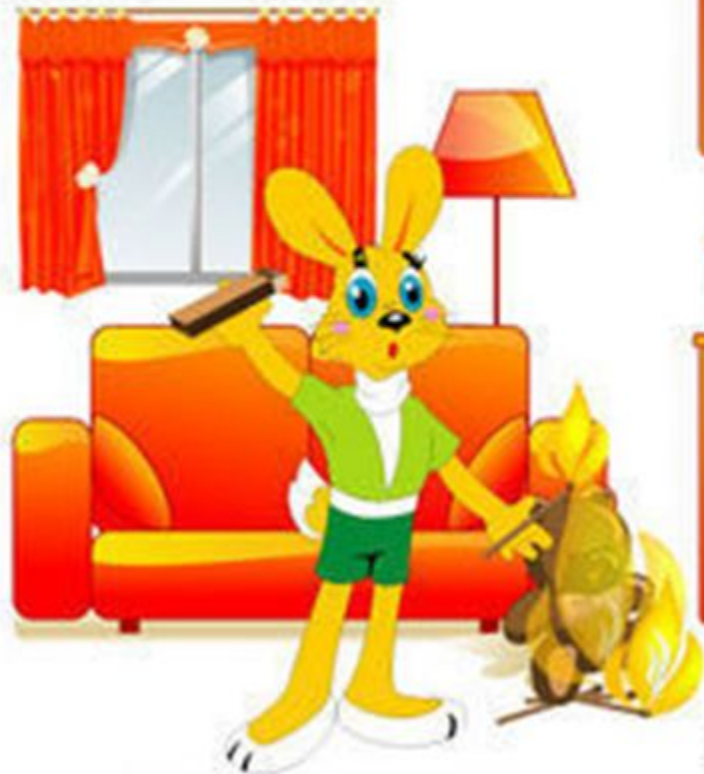
НЕОСТОРОЖНОЕ ОБРАЩЕНИЕ С ОГНЁМ