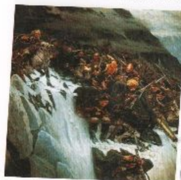
Переход Суворова через Альпы в 1799 году. 1892