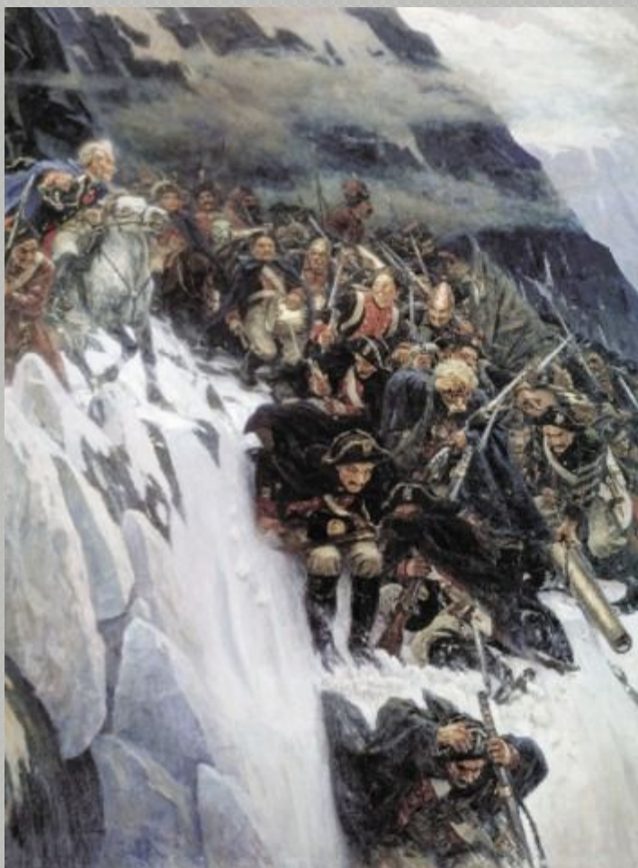
«Переход Суворова через Альпы» Василий Иванович Суриков (1899 год) Русский музей, Санкт-Петербург