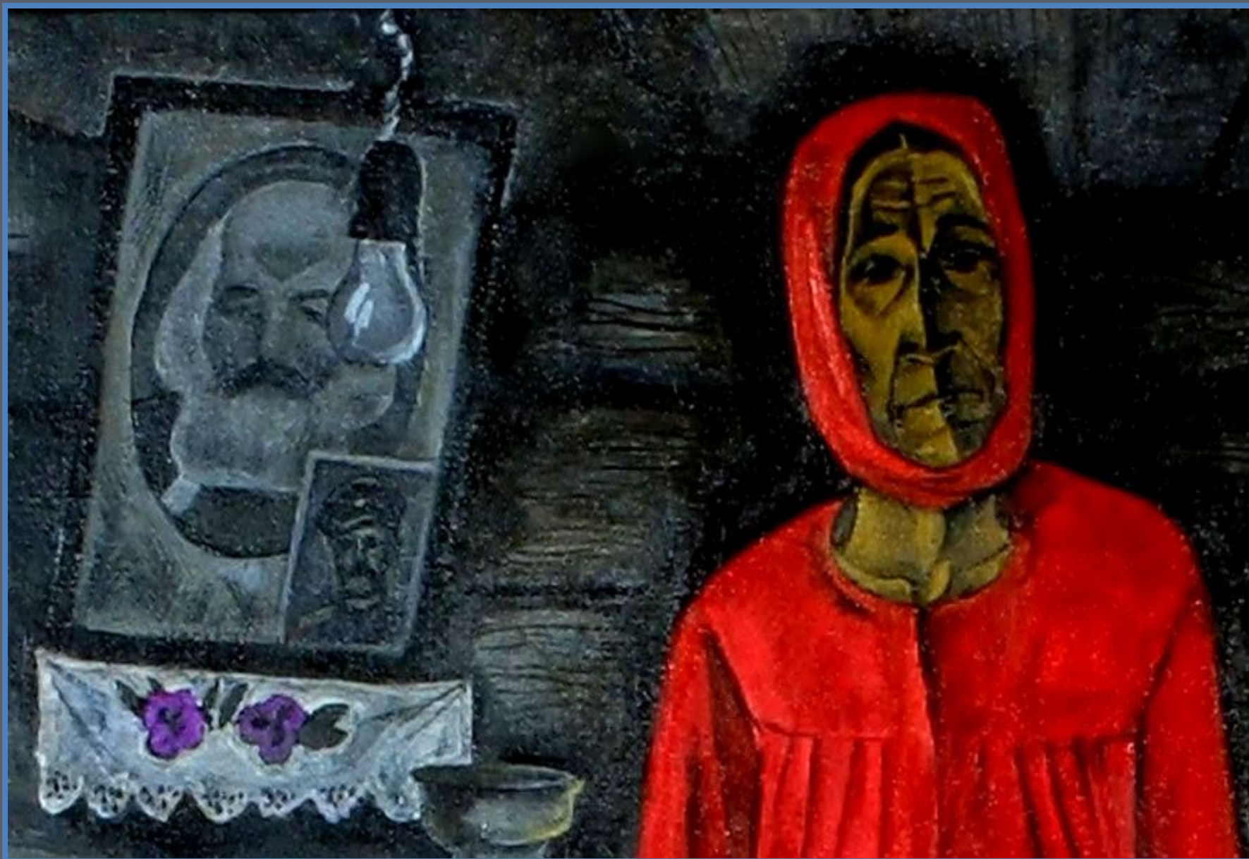
Воспоминания. Вдовы. Фрагмент картины. 1966 год