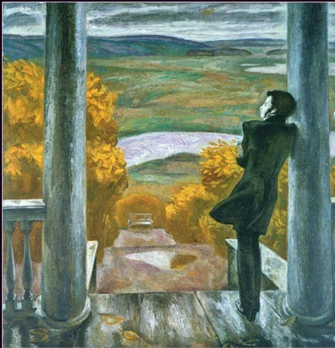
Осенние дожди (Пушкин). 1974

Эта картина – импровизация на тему Пушкина. Она позволила художнику окунуться в мир поэтических переживаний.