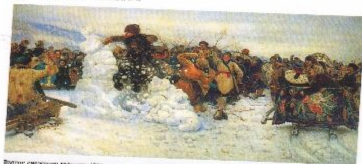
Война швейцарского горняка. 1899