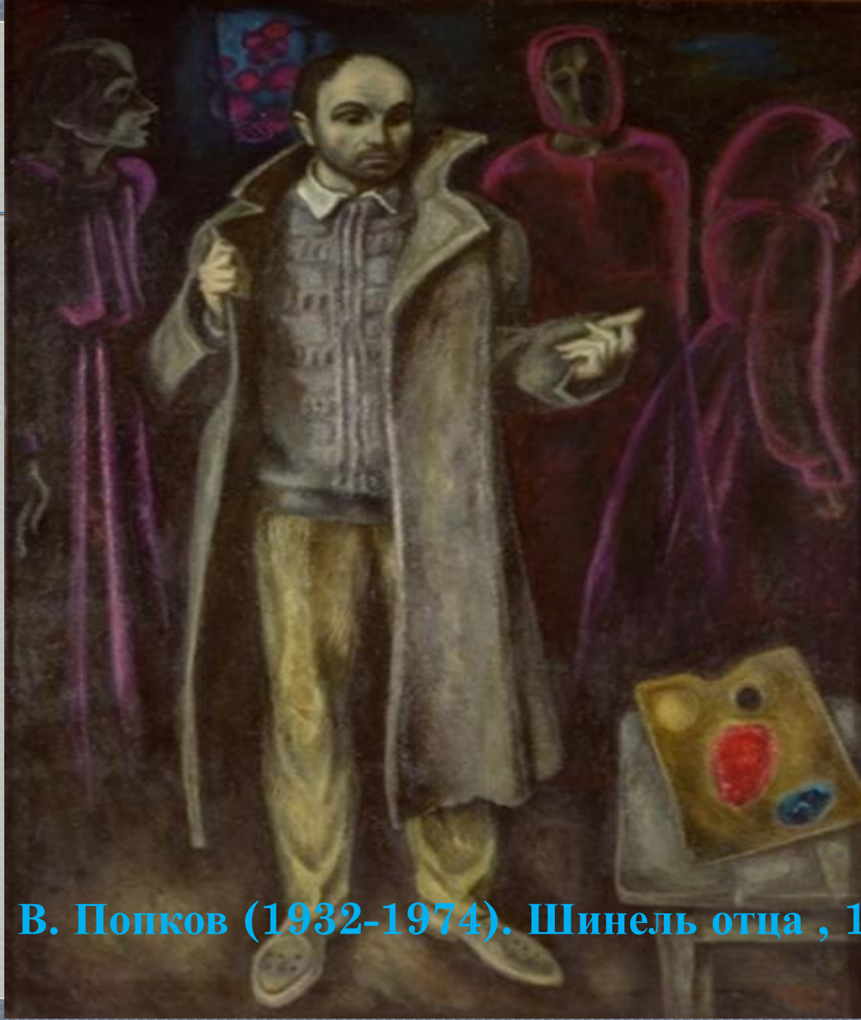
В. Попков (1932-1974). Шинель отца , 1972 г.