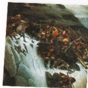
Переход Суворова через Альпы в 1799 году. 1899