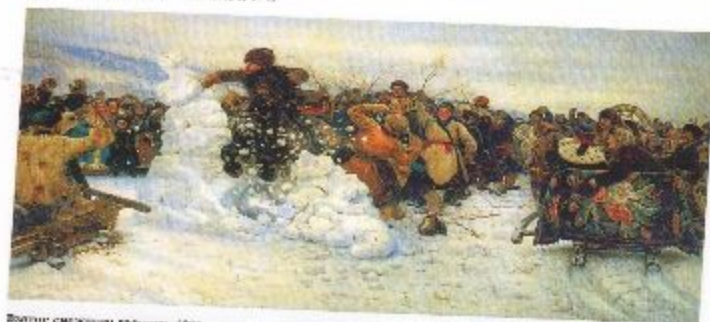
Война швейцарского горняка. 1893