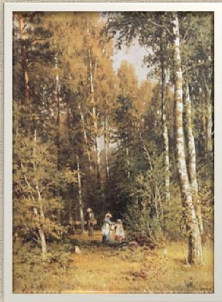
Березовый лес. 1871