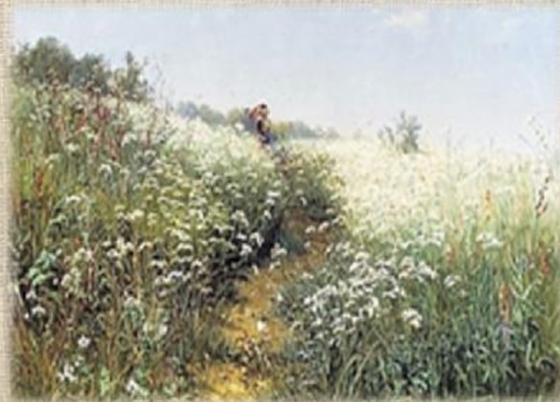
Женщина под зонтиком на цветущем лугу. 1881