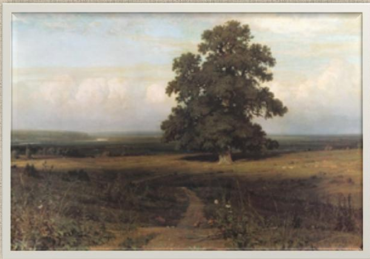
"Среди долины ровныя ...". 1883