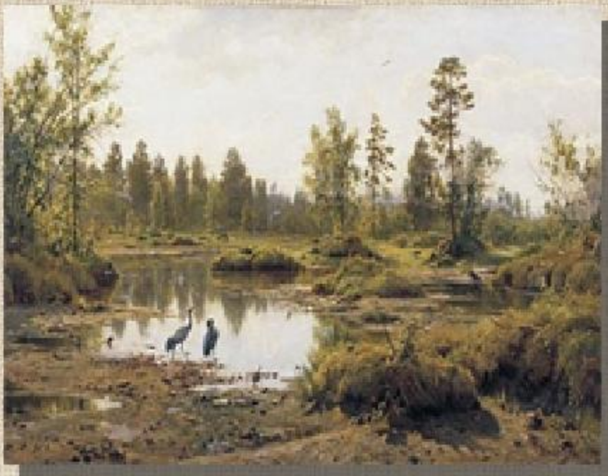
Болото. Полесье. 1890