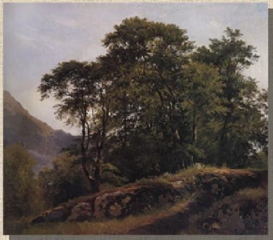
Буковый лес в Швейцарии. 1863