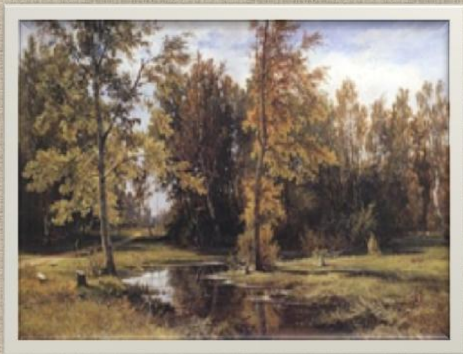
Березовая роща. 1878