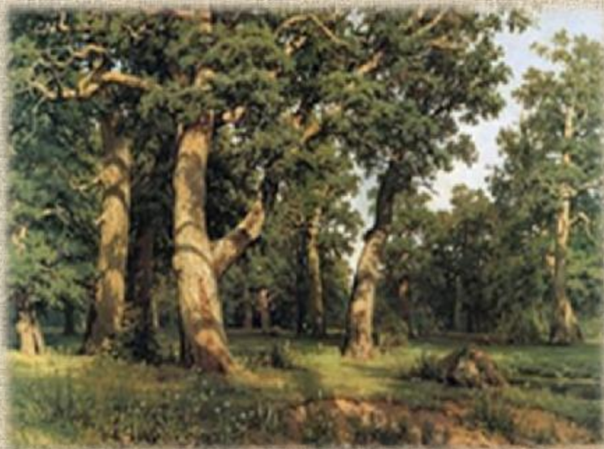
Дубовая роща. 1887