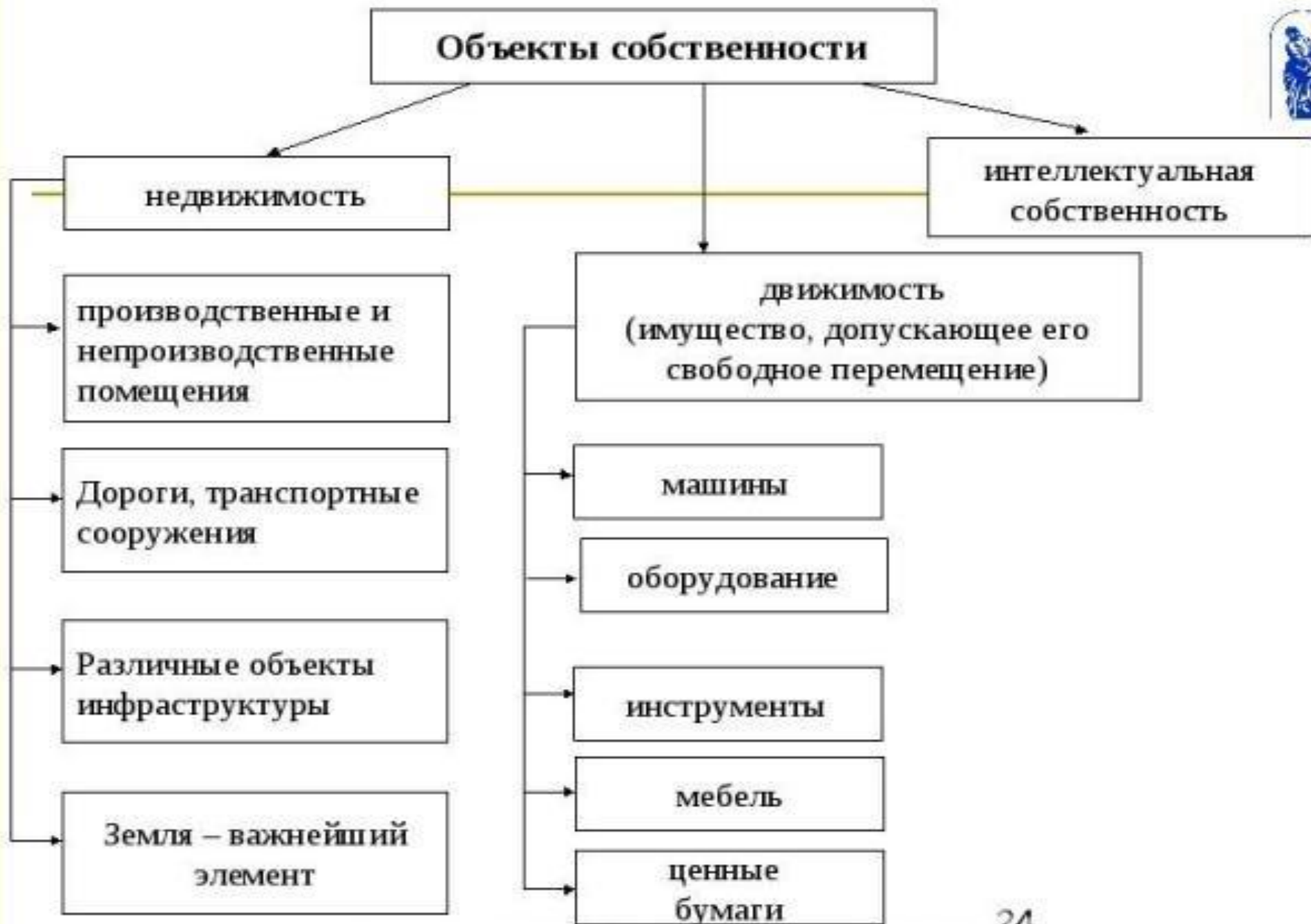
Рисунок – классификация объектов собственности