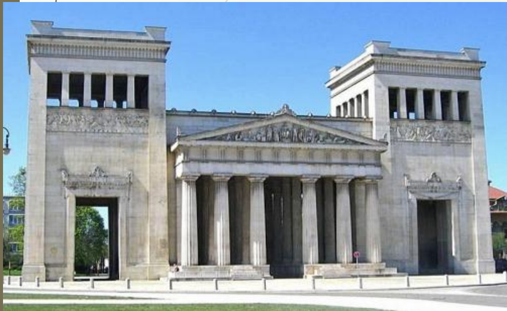
Пропилеи баварского зодчего Лео фон Кленце (1784—1864 гг.)