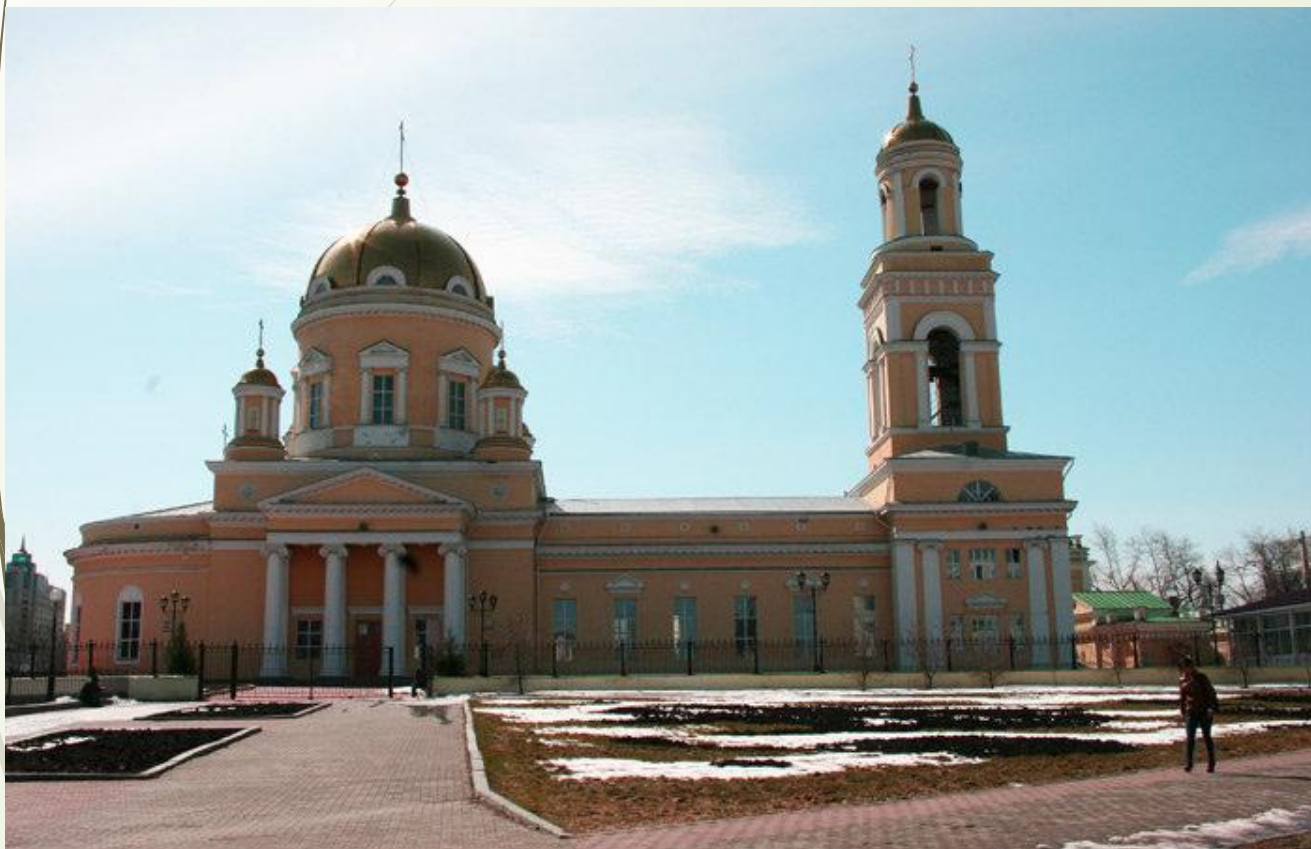
Церковь Святой Троицы

Классицизм — художественный стиль и эстетическое направление в европейской культуре XVII—XIX вв.