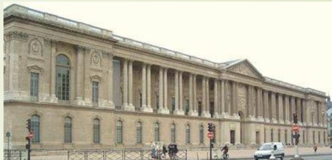
Восточный фасад Лувра. Архитектор Клод Перро