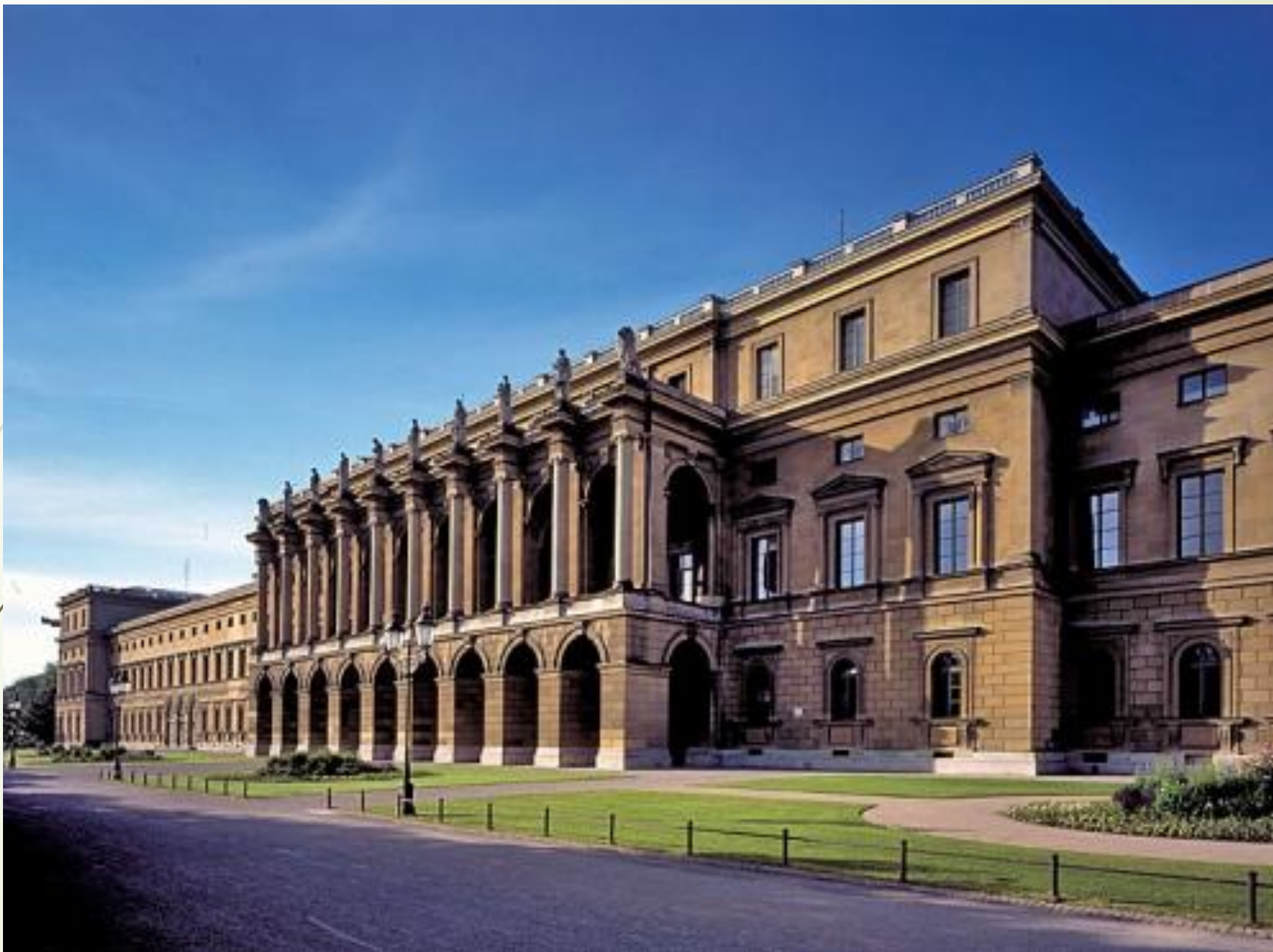
Резиденция королей в Мюнхене.