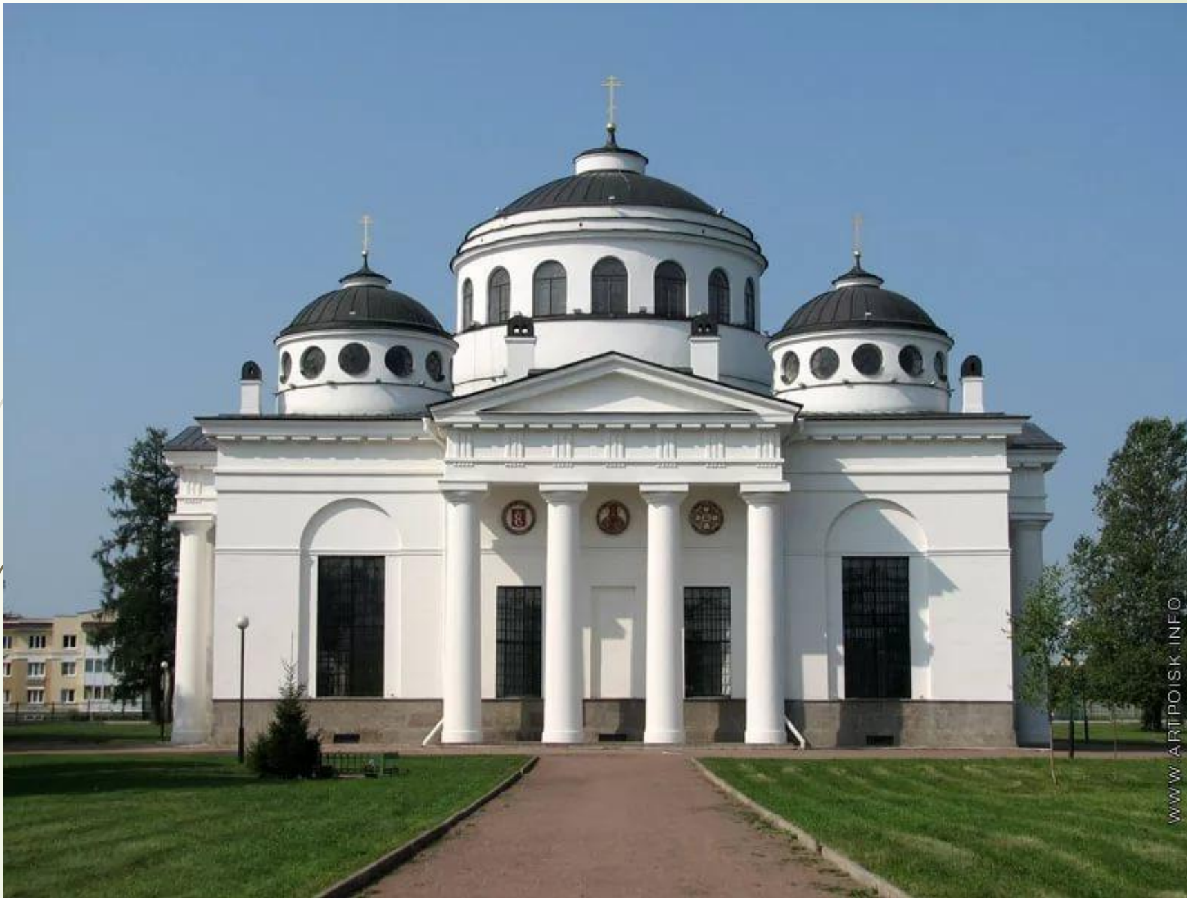
Софийский собор в Пушкине