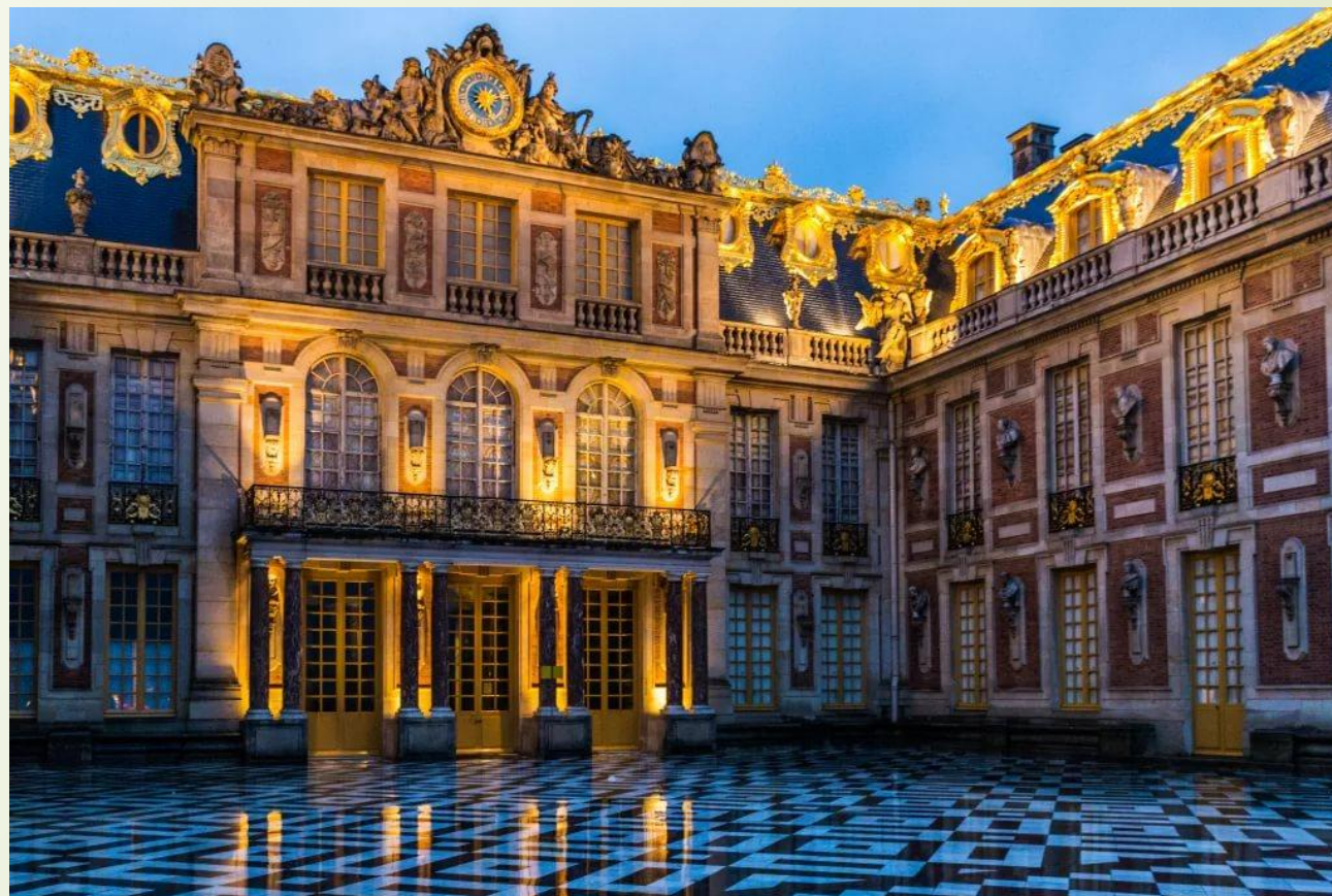
Версальский дворец. Франция