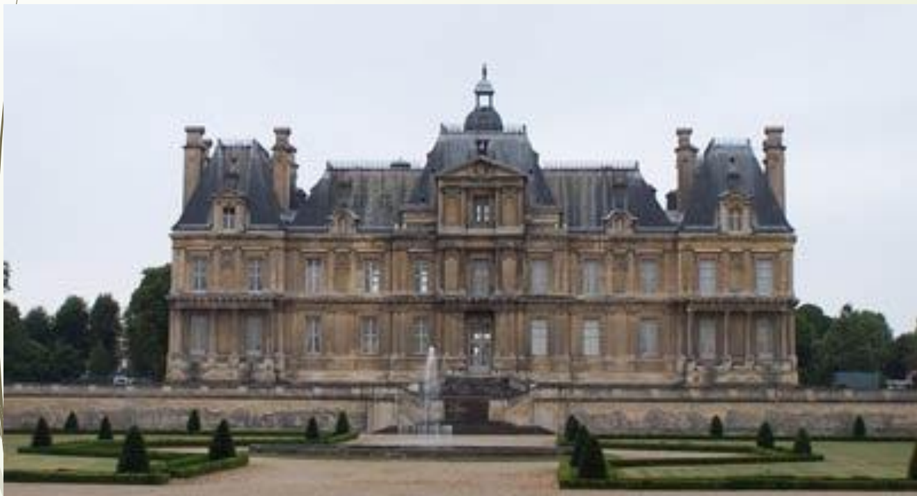
Мезон-Лаффит (1642–1651) Архитектор Никола Франсуа Мансар