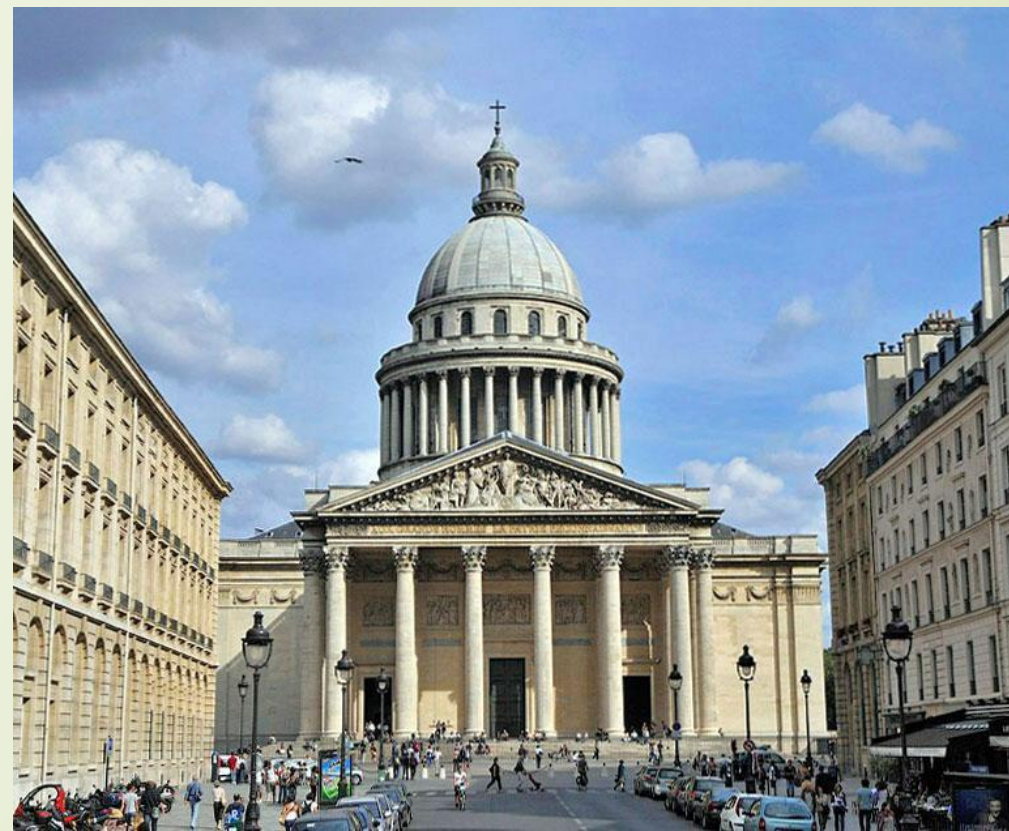
Пантеон в Париже. Архитектор Суффло