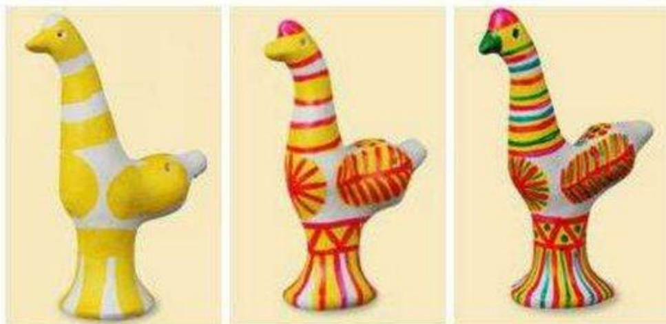
Элементы росписи филимоновской игрушки.