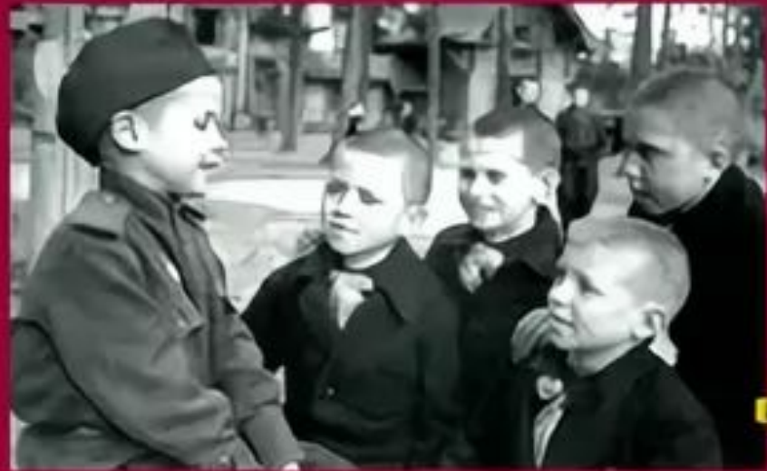
6-летний сын полка в новом детском доме