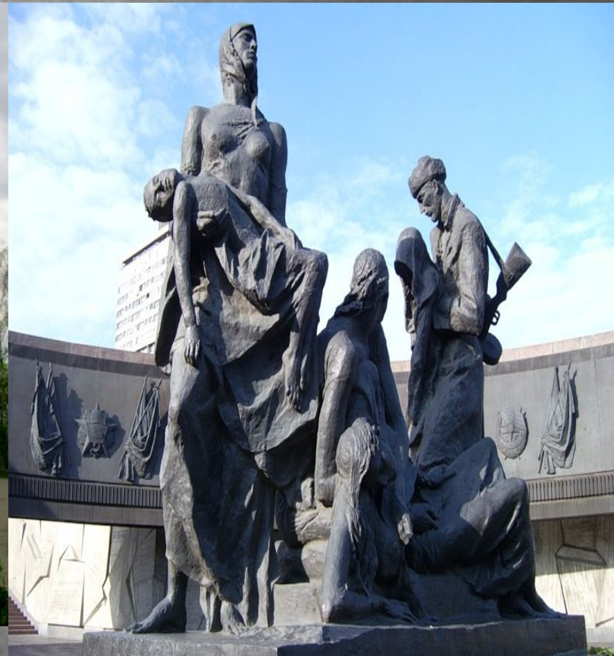
Памятник героическим защитникам блокадного Ленинграда.