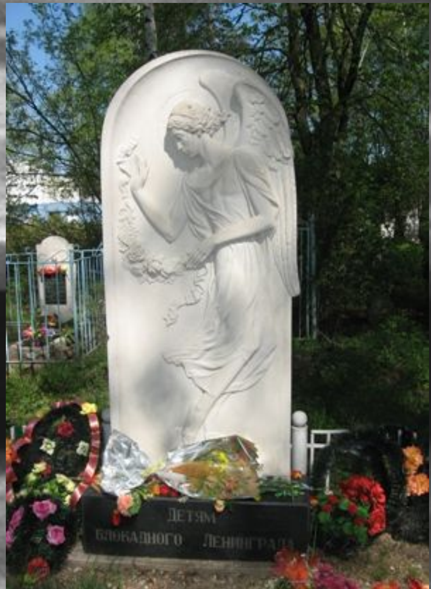
Памятник детям блокадного Ленинграда (Ярославль).