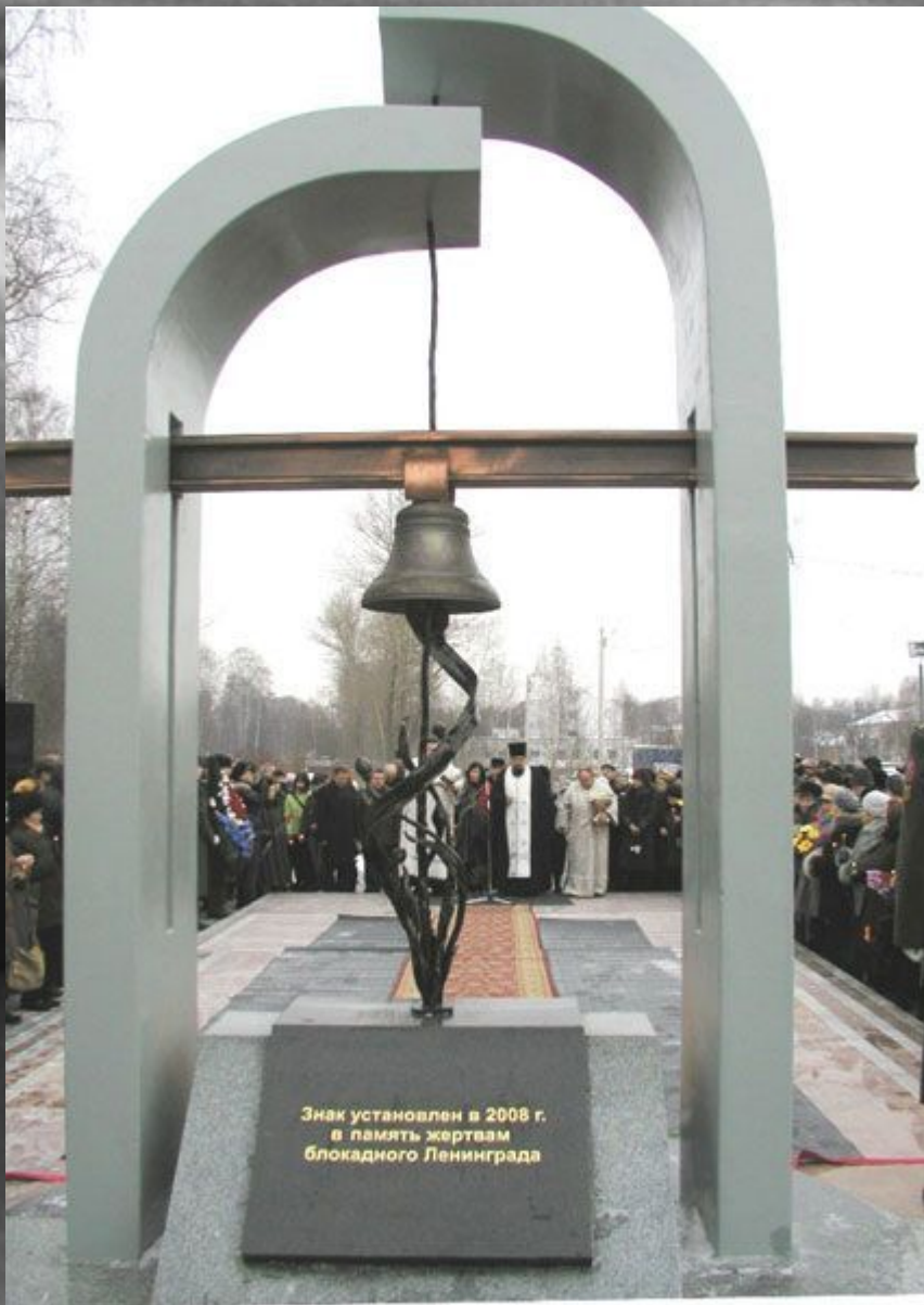
В Ярославле памятник жертвам блокадного Ленинграда.