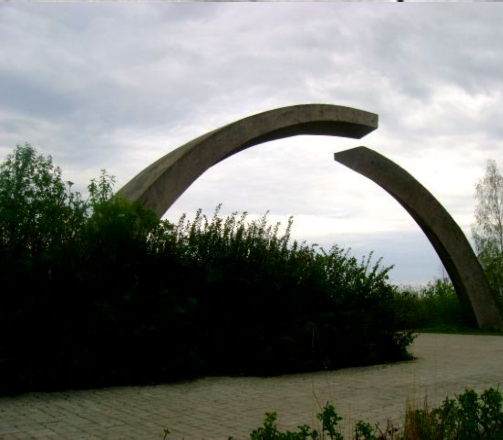
Памятник в честь разрыва блокады Ленинграда!