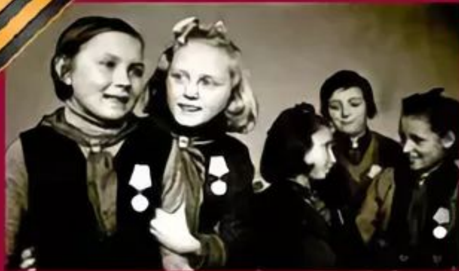
4-классницы, «За оборону Ленинграда»