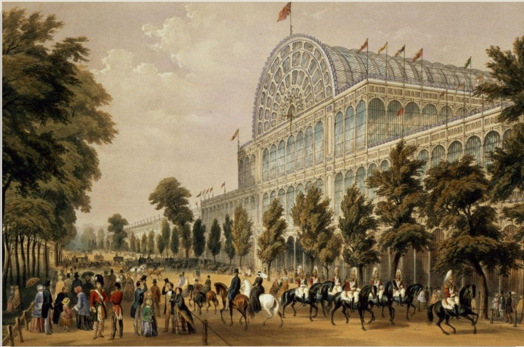
Хрустальный дворец. Англия 1851 г.