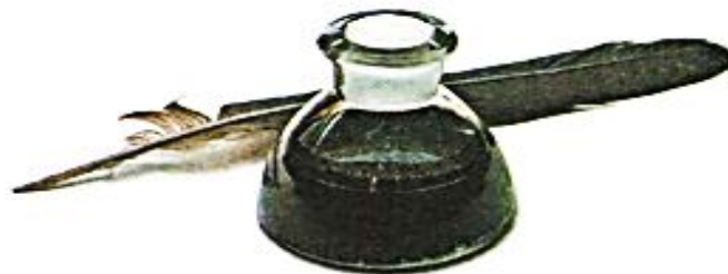
перо, чернила, чернильница