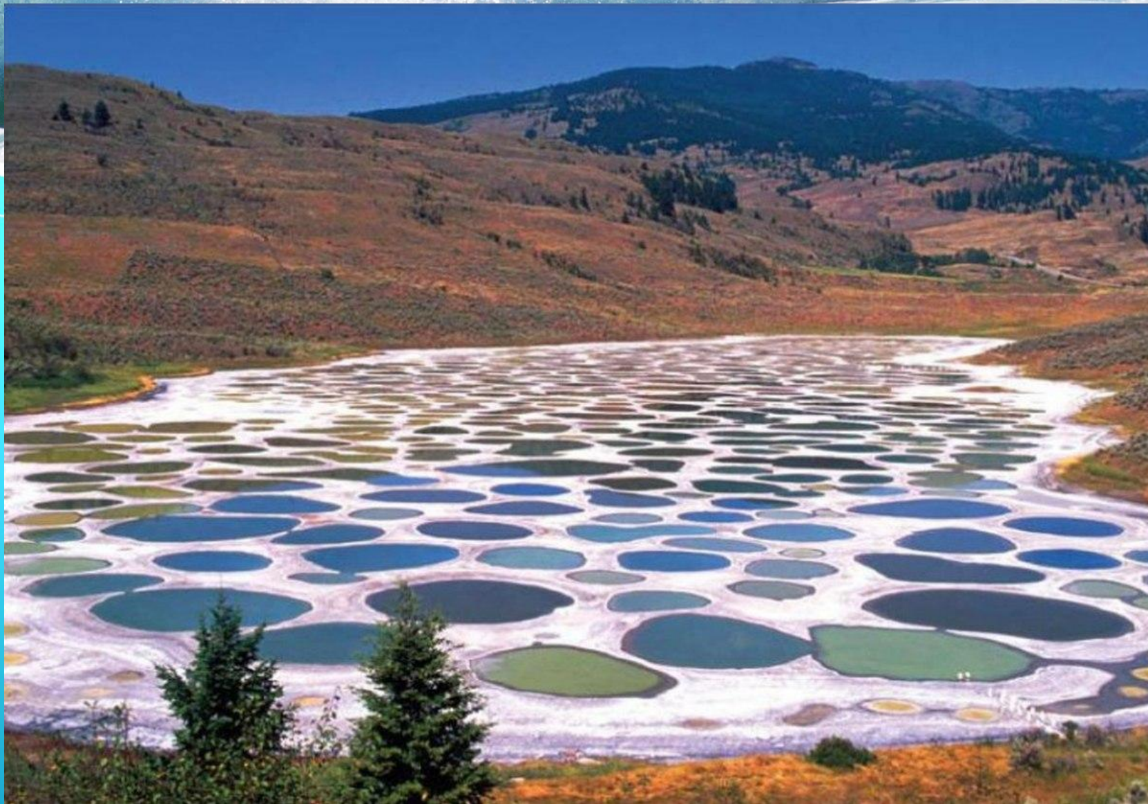
Озеро Клилук, США