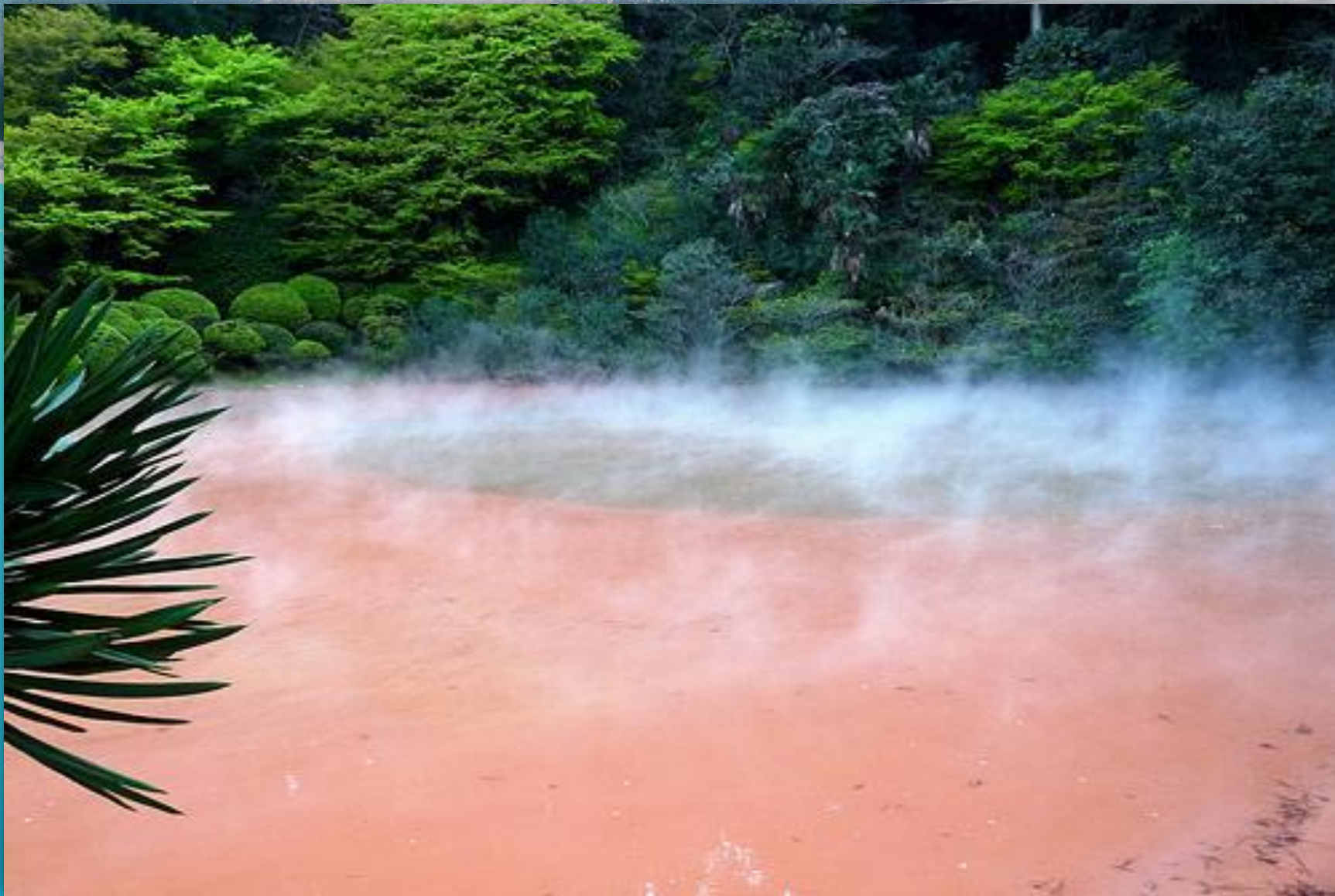
Двухцветное озеро на острове Кюсю