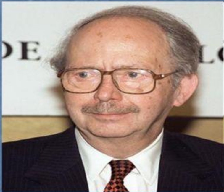
Ральф Густав Дарендорф