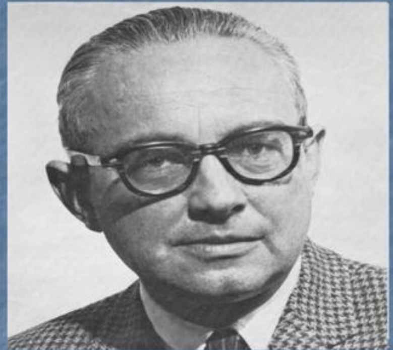
Льюис Альфред Козер