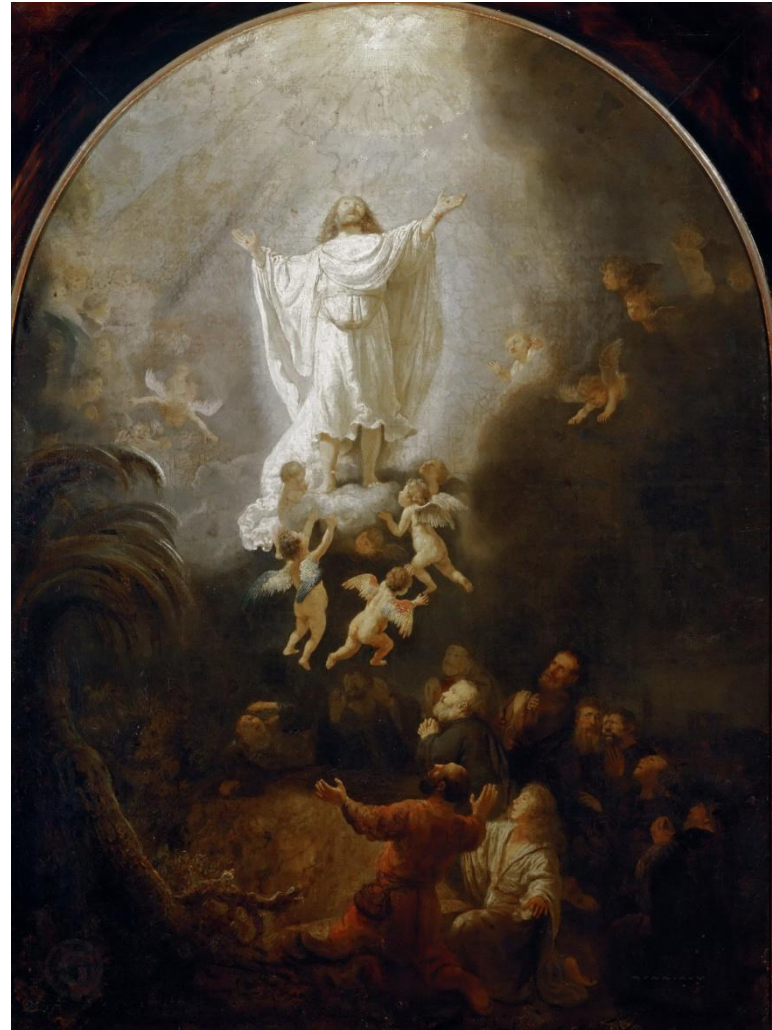
Рембрандт Харменс ван Рейн Вознесение Христа 1636 г. Старая Пинакотека, Мюнхен