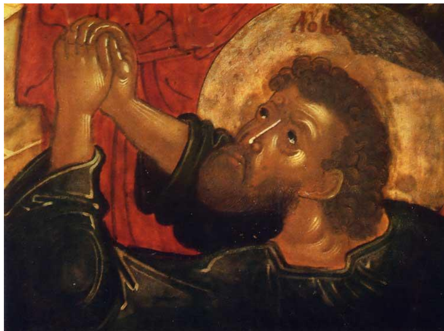
Вознесение Господне Федор Zubов 1660 г. Церковь Ильи Пророка в Ярославле