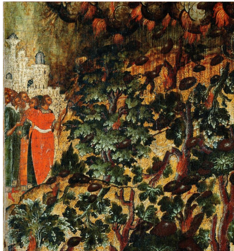
Праведный Прокопий Устюжский с житием 1668-1669 гг.