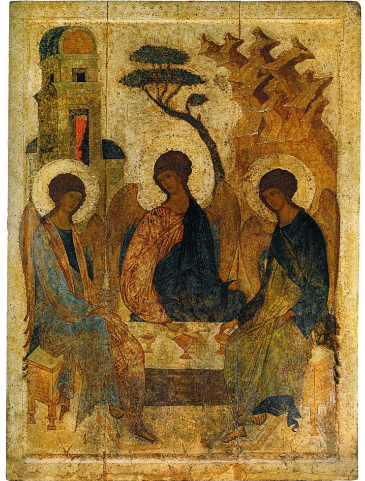
Троица Кон. XV – нач. XVI вв. ЦМиАР