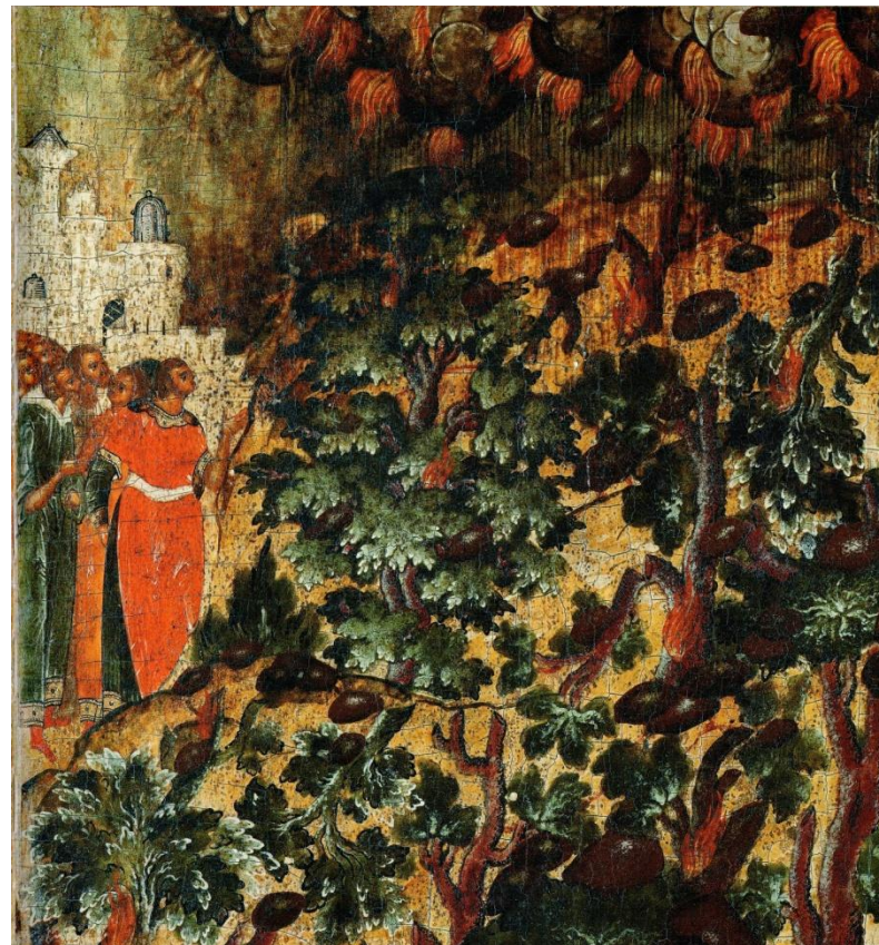
Праведный Прокопий Устюжский с житием 1668-1669 гг.