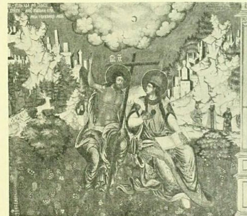
Фреска Ярославской церкви Иоанна Предтечи въ Толчковѣ. 1691 г.