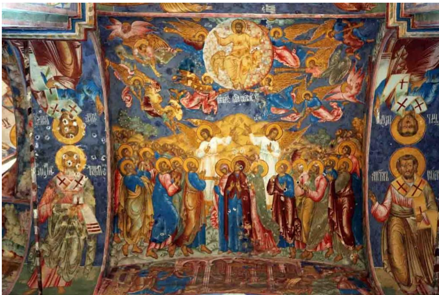
Вознесение Церковь Ильи Пророка в Ярославле 1680 г.