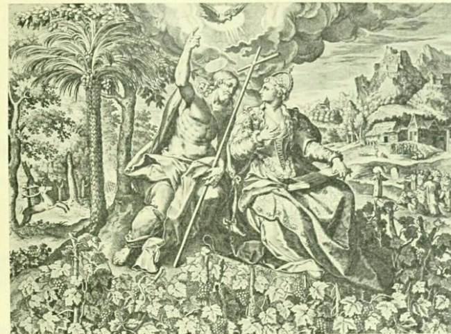
«Иъсъ Иъсней». Христосъ съ «Невъстой». Гравюра Пискатора. —1640-е годы.