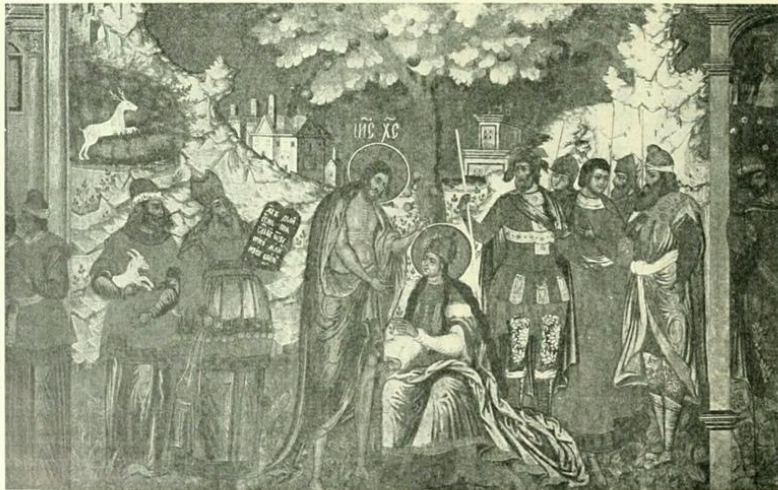
«Иъсъ Иъсней». Христосъ съ «Невъстой». Гравюра Пискатора (1640-хъ годовъ) и фреска Ярославской церкви Иоанна Предтечи въ Толчковѣ. (1691 г.).