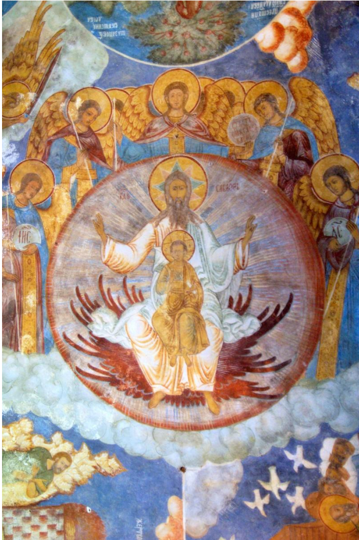
Отечество Церковь Ильи Пророка в Ярославле 1680 г.