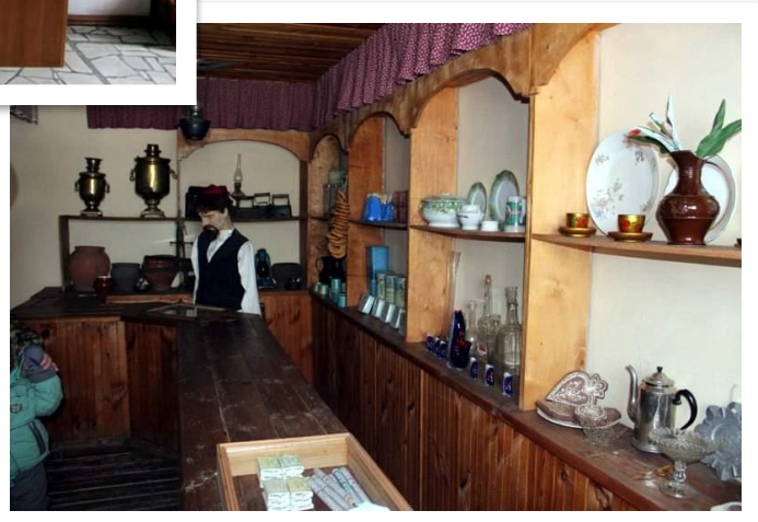
Г.Исхакый музей-йортында, Яуширмә авылы, Чистай районы