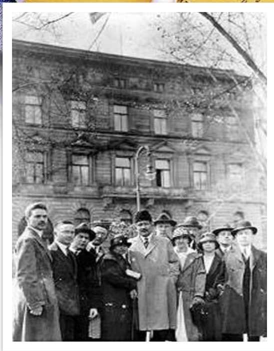
Варшава шәһәрндә, 1938 ел