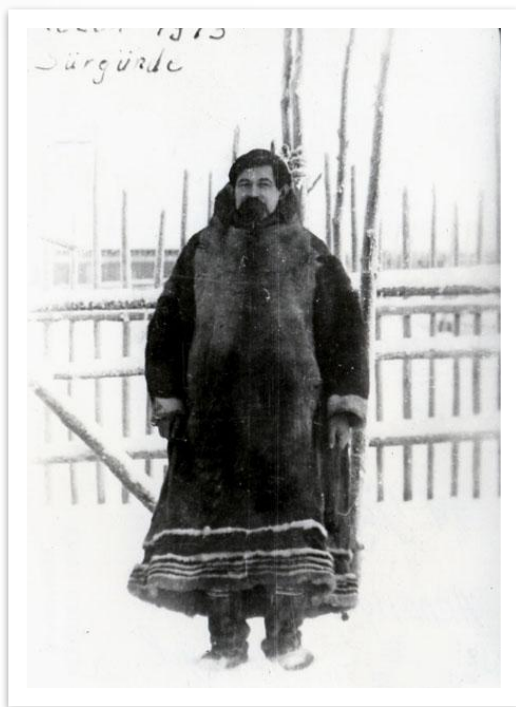
1907 елда Архангел губернасында сөргендә

1905 елдан 1917 елга кадәр ул бик күп әсәрләр яза. Бу вакыт эчендә ул 30 роман, драма әсәрләре яза. Аның «Зиндан», «Теләнче кызы», «Сөннәтче бабай», «Солдат» дигән әсәрләре аеруча абруй казана.