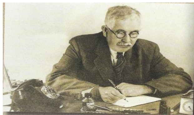
1928 елда Берлинда «Милли юл» дигән журнал чыгара башлый.

1919 елда чит илгә китә һәм шуннан Ватанга әйләнәп кайтмый. Туган иленнән аерылгач, ул Харбин, Париж, Берлин, Варшава һ.б. шәһәрләрдә яши.