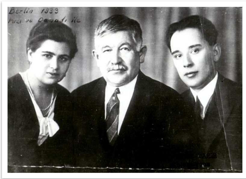
Г.Исхакый гаиләсе белән (кызы Сәгадәт һәм кияве), Берлин, 1933 ел

Гаяз Исхакый Төркиягә күчә һәм үзенен әдәби, политик эшләрен дәвам итә.