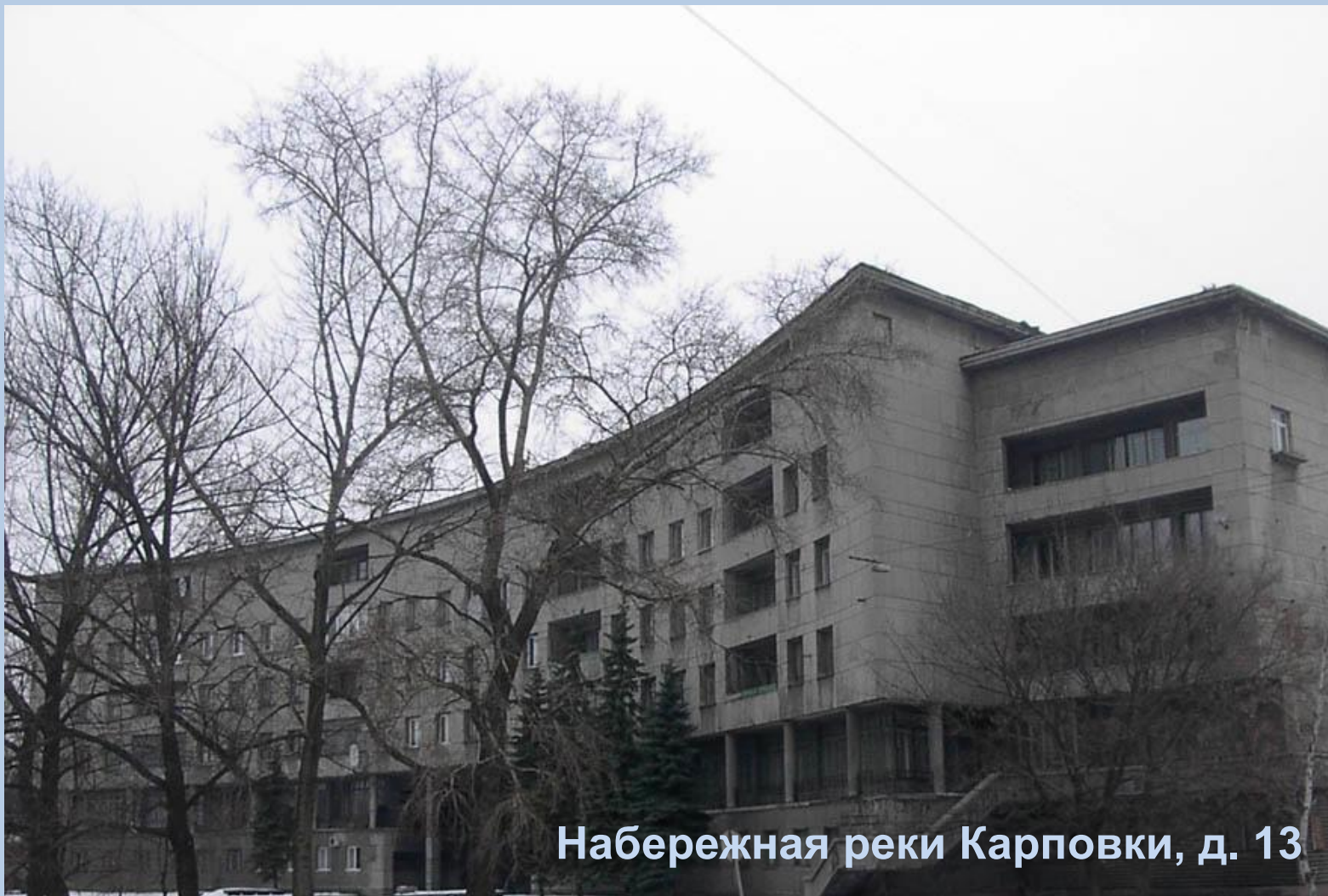
Набережная реки Карповки, д. 13

Для советских и партийных руководителей построили специальный жилой дом. В нём были большие и светлые, отдельные для каждой семьи квартиры. В них газ, ванна, телефон, холодильник, мебель и комнаты для прислуги. В этом доме были прачечная, парикмахерская, гаражи.