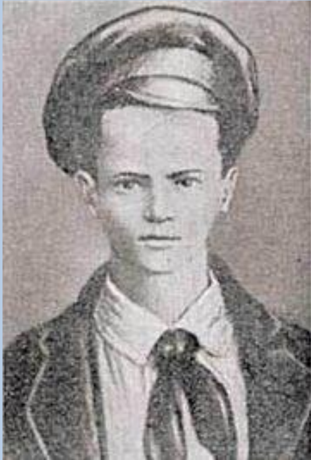
"Пионер-герой" Павлик Морозов. Официальный (идеализированный) портрет.

Среди юных пионеров активно насаждалось доносительство, и согласно идеологии сталинской эпохи, пионер обязан был быть активным агентом тайной политической полиции и сообщать в нее обо всех «безобразиях».