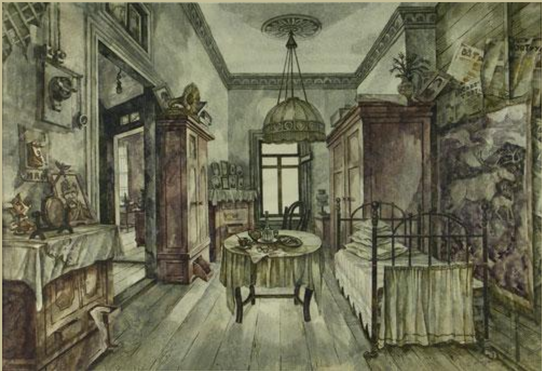
Комната в коммунальной квартире