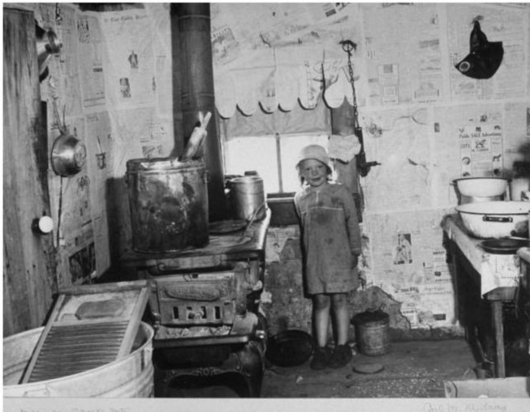
Child in Kitchen