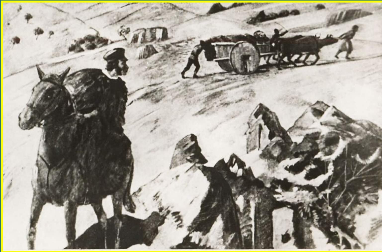
Картина М. Сарьяна. 1936-1947 гг.