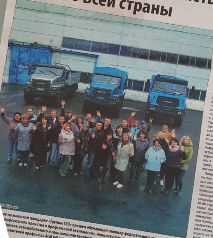
На миасской площадке «Группы ГАЗ» прошел обучающий семинар федерального уровня на тему «Мотивация профсоюзного членства и профсоюзной активности», инициатором которого традиционно выступает профсоюз работников автомобильного и сельскохозяйственного машиностроения. Более подробный материал о семинаре читайте в следующем номере нашей газеты.