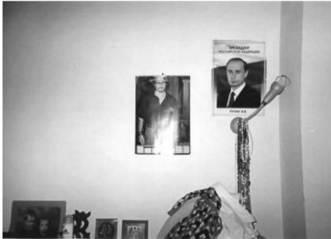
Ил. 4. Портрет В.В. Путина, репрезентирующего «мужскую» силу государства, расположен рядом с портретом актера Дж. Дэйва, символом мужской красоты, в спальне у респондентки.

«Там русский дух...»: вещи в доме как способ визуализации идентичности мигрантов в Великобритании