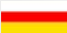
Республика Южная Осетия