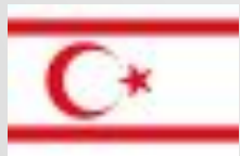
Турецкая республика Северного Кипра

Частично признанные государства — государства, «не признанные ООН, но признанные государствами — членами ООН»