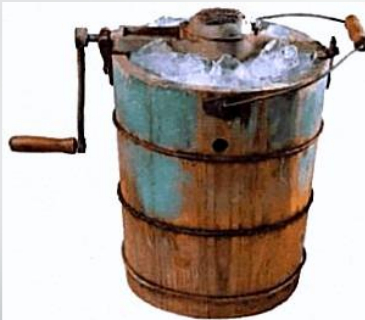
Ручний фризер для приготування морозива Нансі Джонсон (1843 р.)