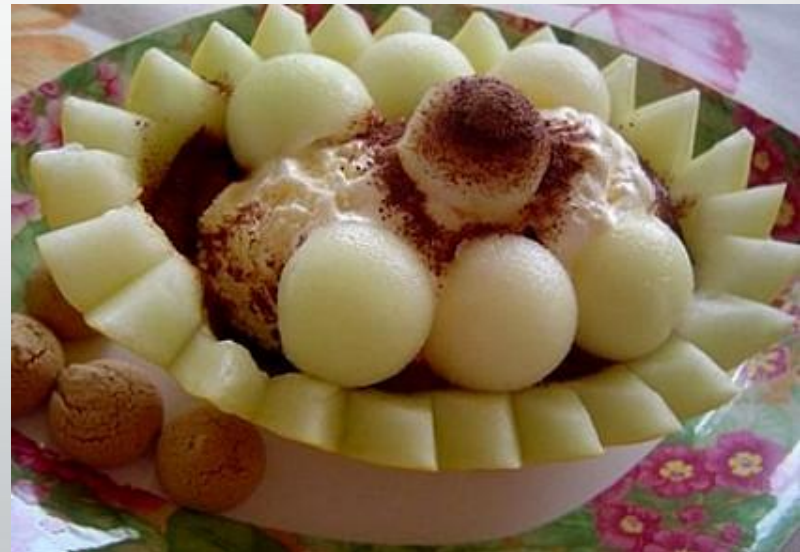
Ароматичне морозиво в дині