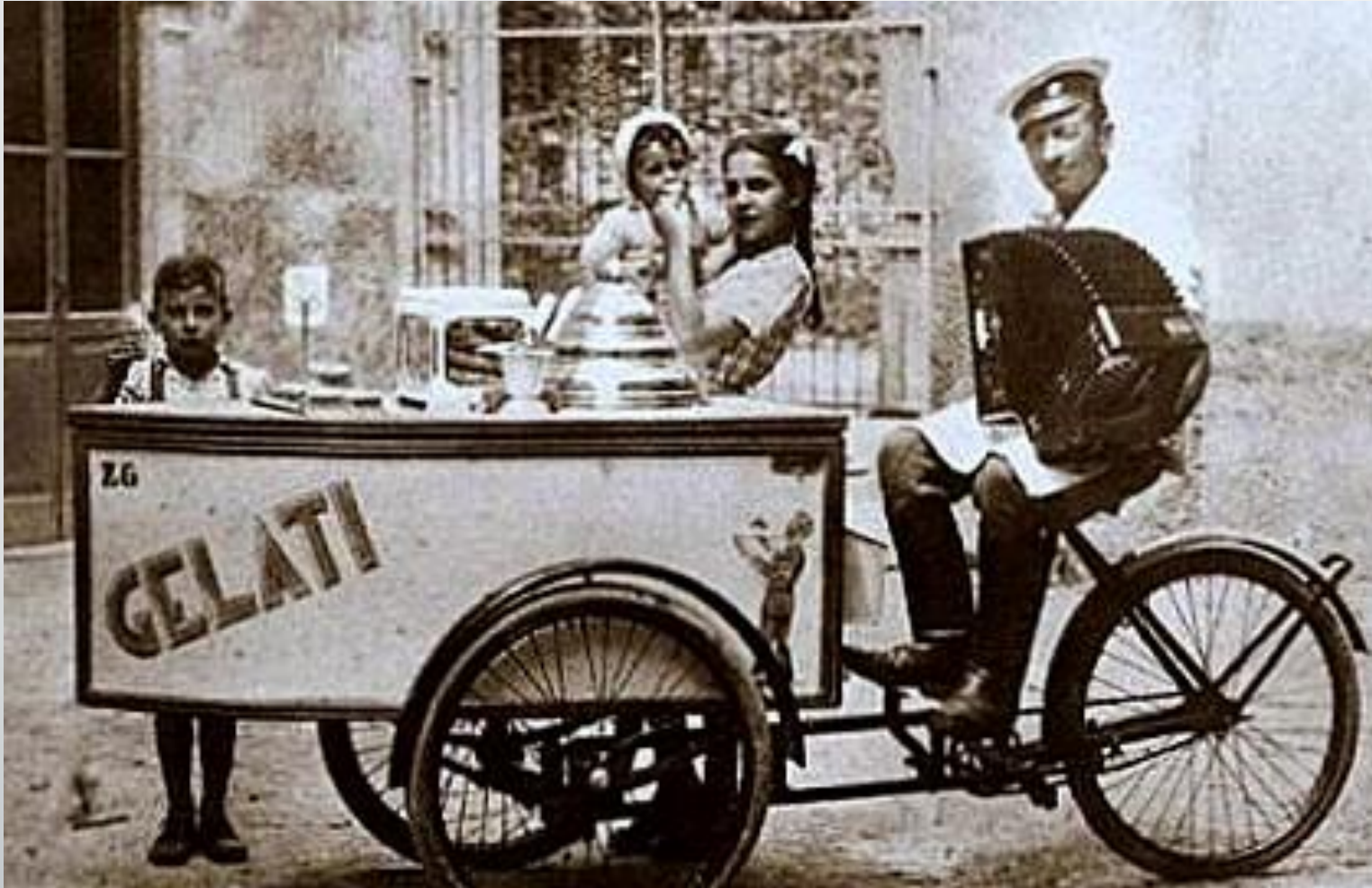
Морозиво в Італії