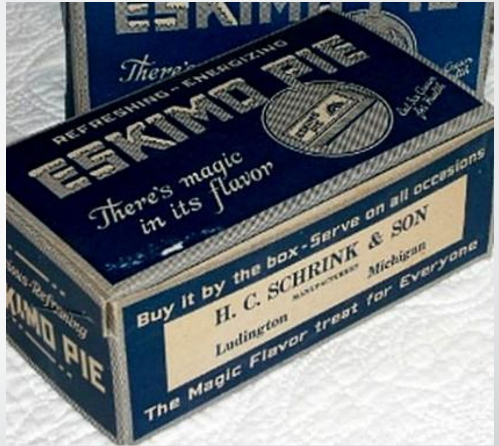
Eckimo Pie Box