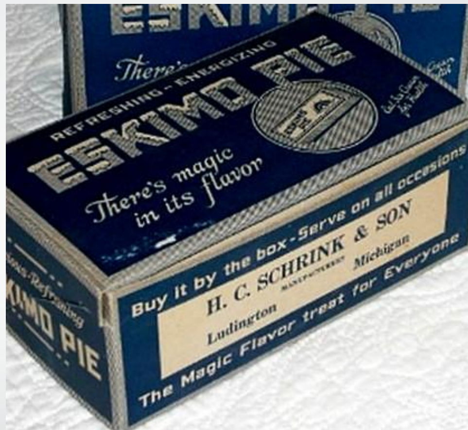
Eckimo Pie Box