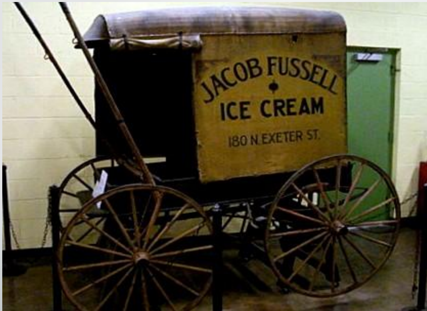
Морозиво Якоба Фусселла