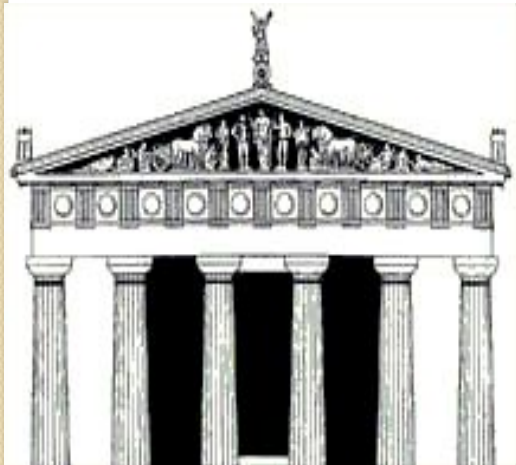
Храм Зевса в Олимпии

ОЛИМПИЙСКИЕ ИГРЫ в античности справлялись в честь Зевса Олимпийского через каждые четыре года, летом, в Элиде (области на северо-западе Пелопоннеса) в Священном городе Олимпии у подножия горы Олимп.