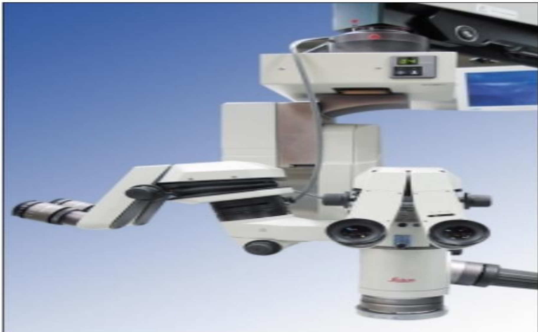
Рис. 3.4. Операционный микроскоп