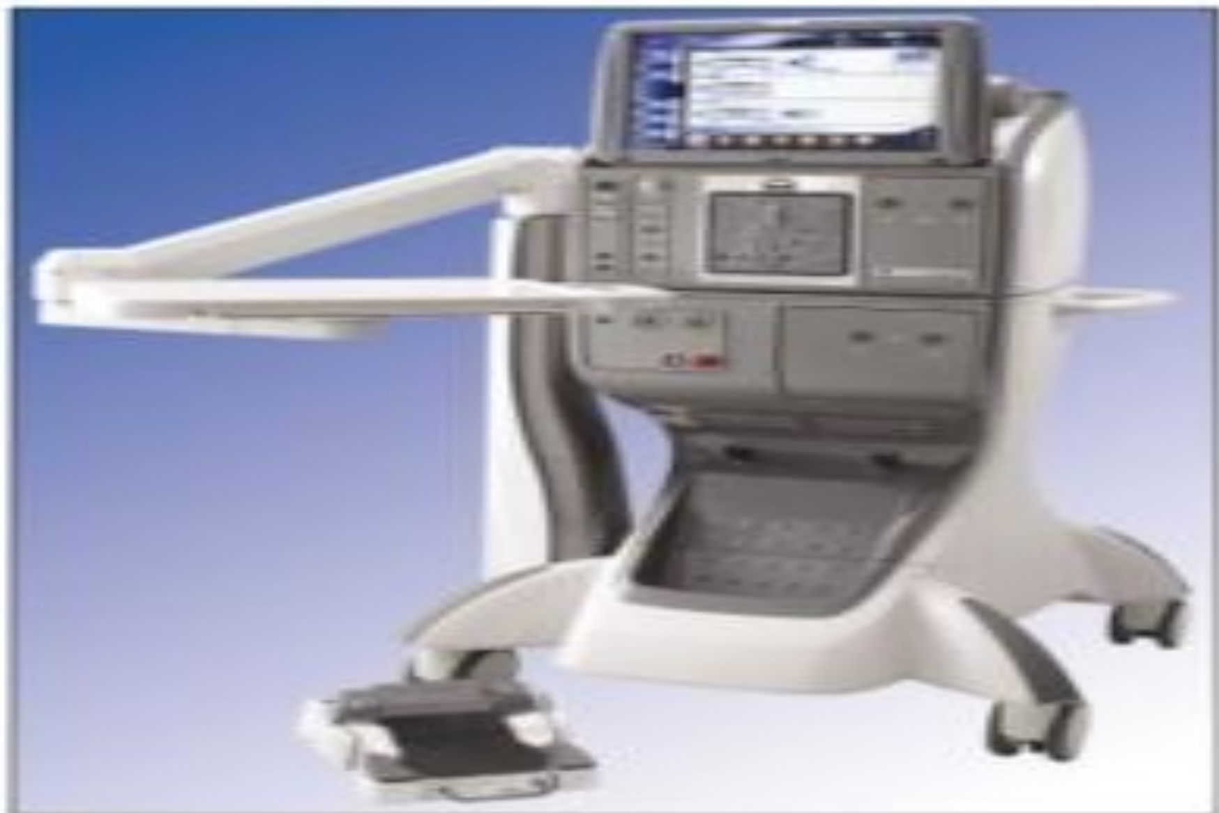
FIG. 3.7. Вспомогательная Констелляция (Alcon)