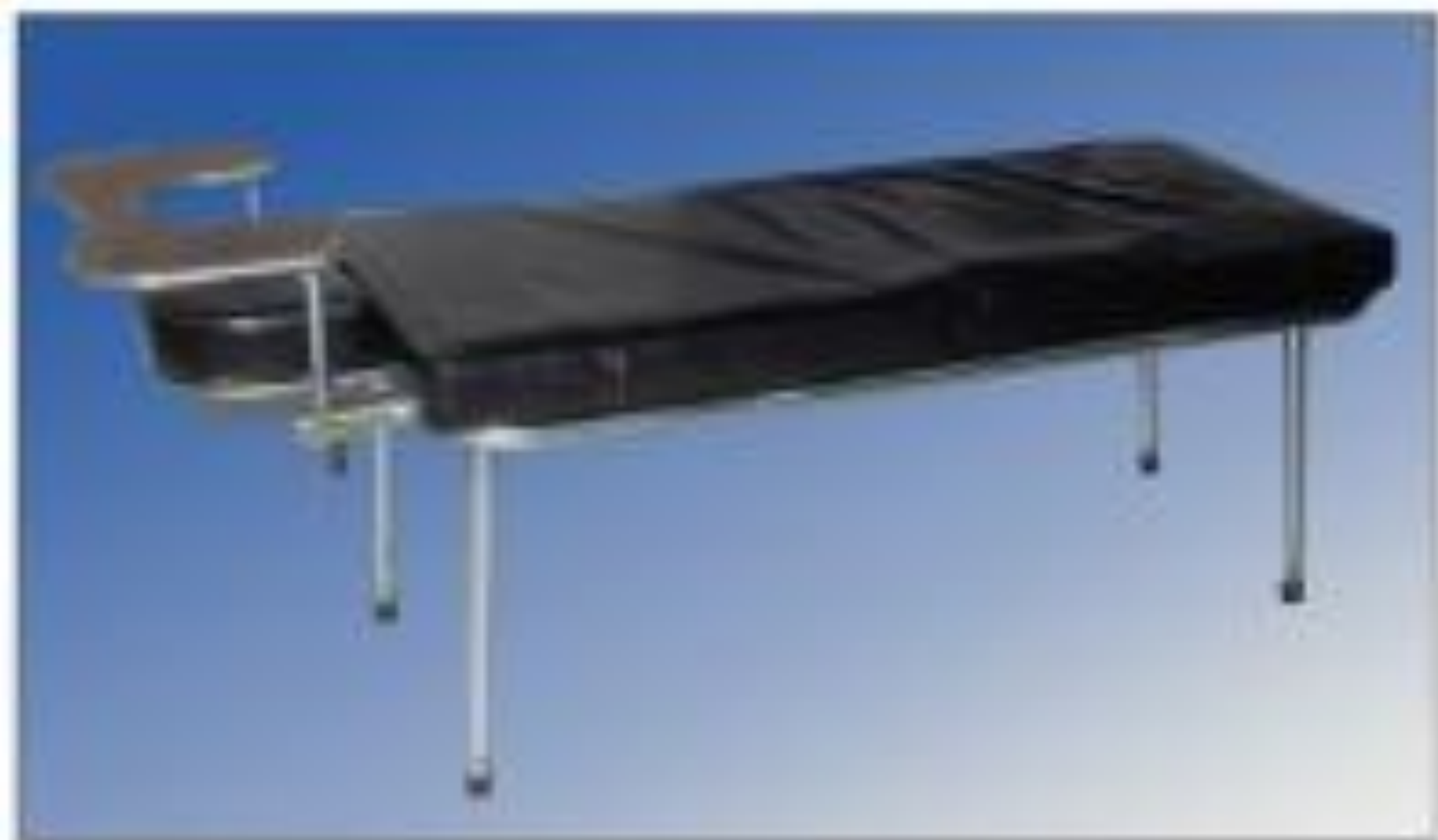
Рис. 3.1. Операционный стол