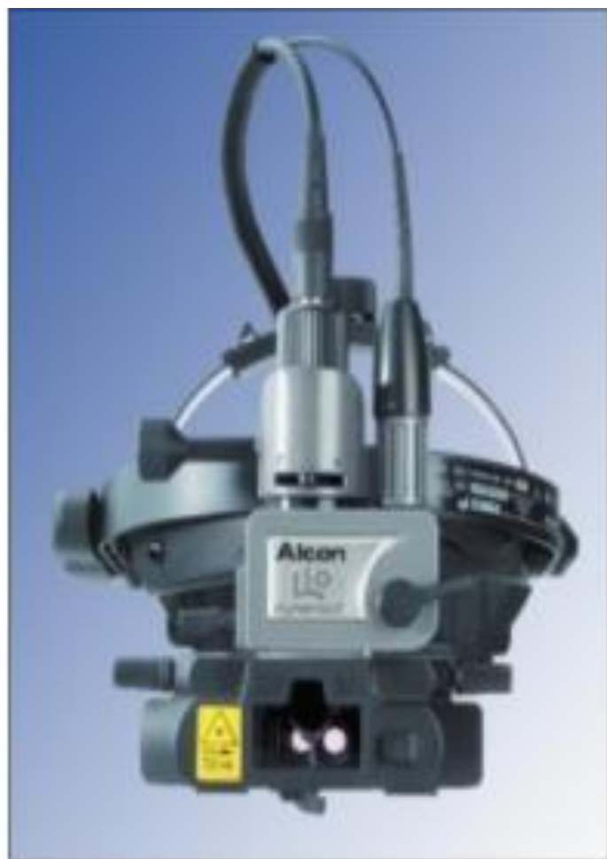
Рис. 3.21. Непрямой бинокулярный офтальмоскоп