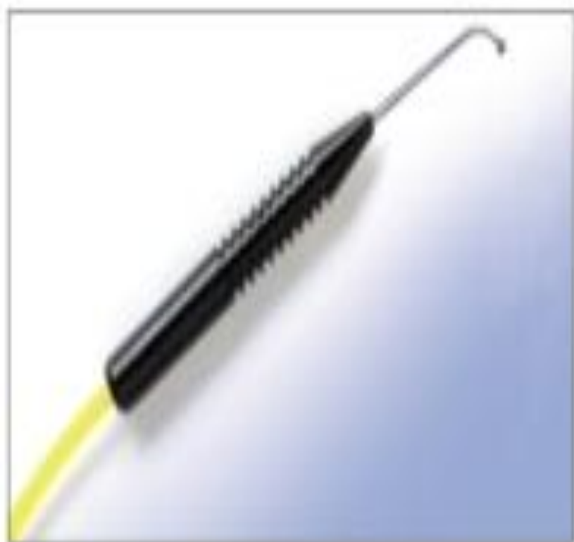
Рис. 3.19. Склеральный конпрессор с волоконным освещением