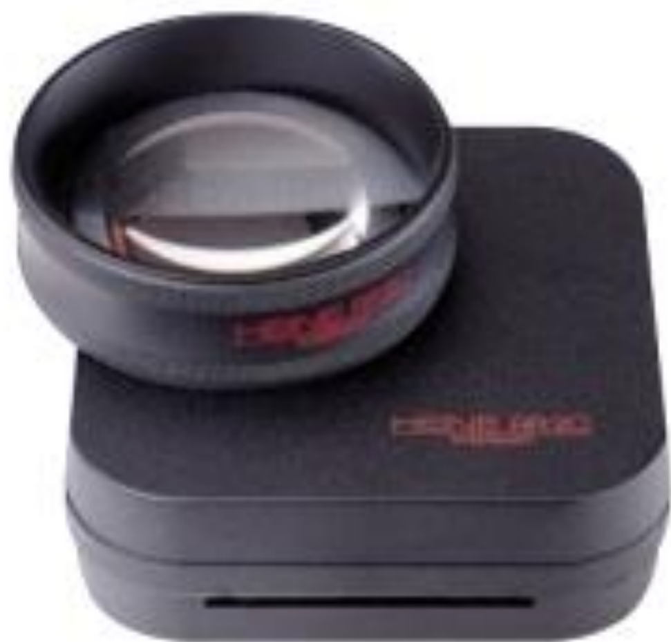
Рис. 3.22. Асферическая линза