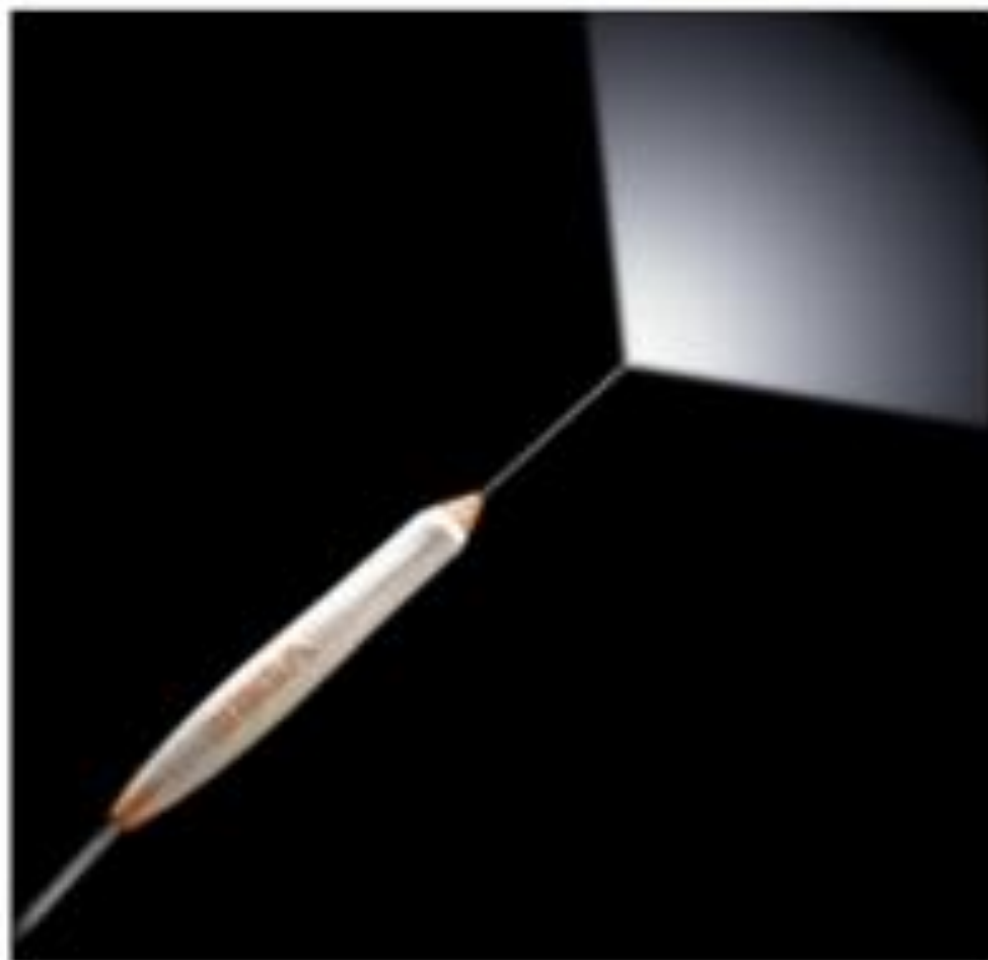
Рис. 3.13. Световод эндоскописта