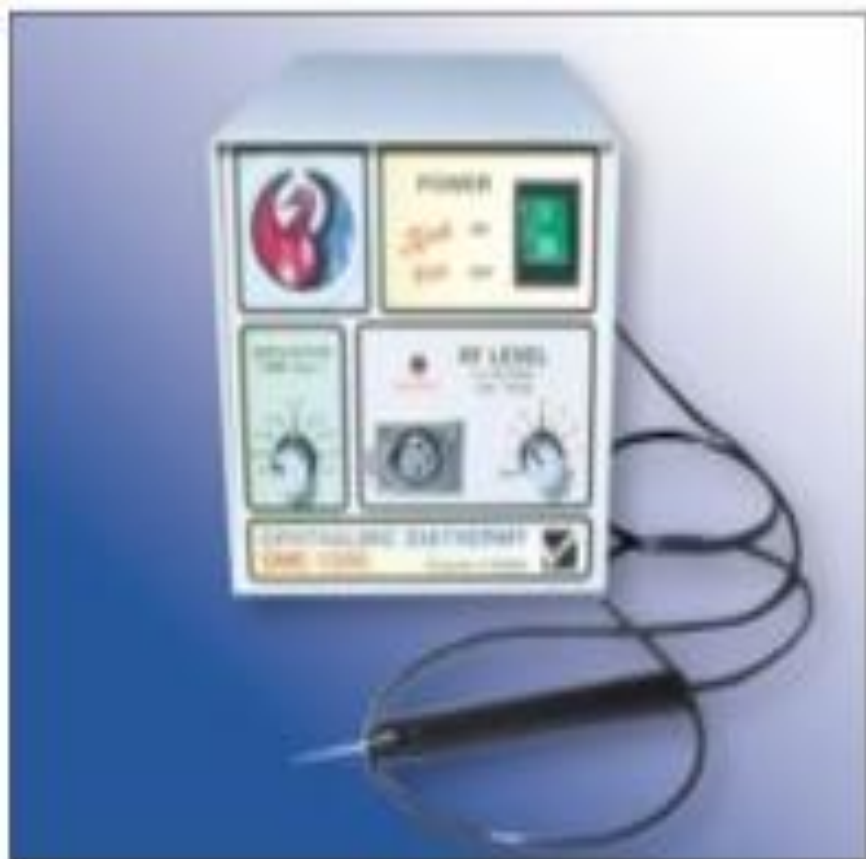
Рис. 3.23. Радиочастотный диатермокоагулятор