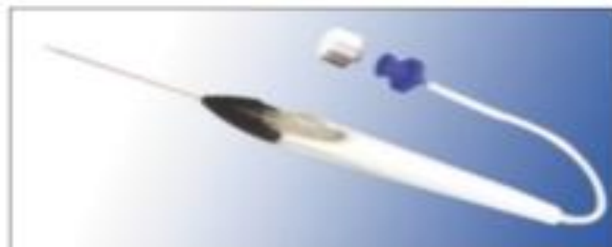
Рис. 3.12. Длинная инфузионная канюля