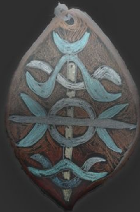
Пример «печати в теле»